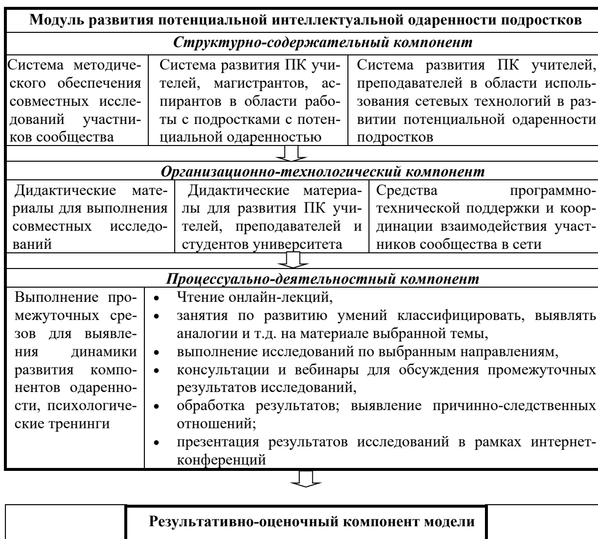
Рис. 2. Модуль развития потенциальной интеллектуальной одаренности подростков в сетевом исследовательском сообществе: ПК – профессиональная компетентность

предлагаемому направлению, доступность методов и методик исследований для подростков и учителей как в теоретическом, так и в практическом аспектах (наличие необходимого оборудования, реагентов, материалов и т.д.). Научные интересы сотрудников университета, как правило, связаны с основными направлениями исследований, выполняемых в данном вузе. Так, в Красноярском государственном педагогическом ведутся исследования по таким направлениям, как «Природа, природные ресурсы и развитие производительных сил Сибири и Центральной Азии».