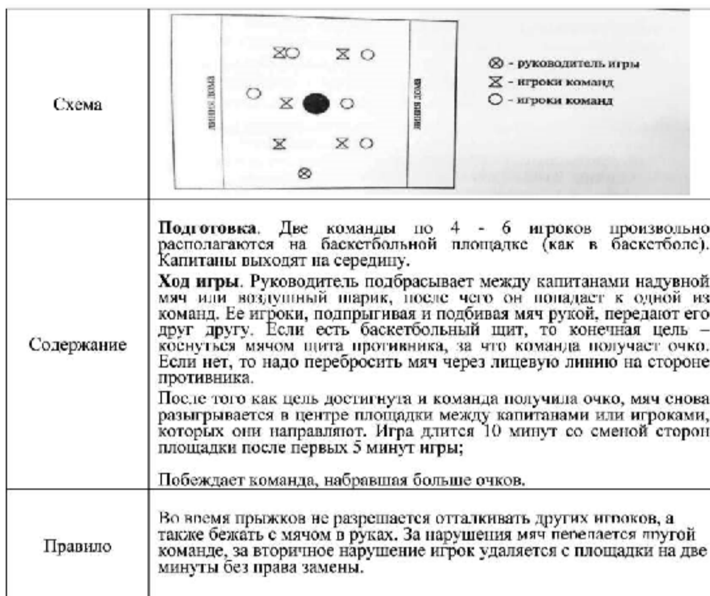
Рис. 1. Пример карточки на русском языке