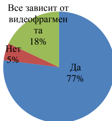
Рисунок 2 – результаты анкетирования обучающихся 8-х классов по вопросы №2

На первый вопрос положительно ответило примерно треть обучающихся – предпочитают сериалы с оригинальным переводом, хотя многие заявили об использовании субтитров. На вопрос об использовании видеофрагментов на уроках английского языка большинство ответило также положительно -