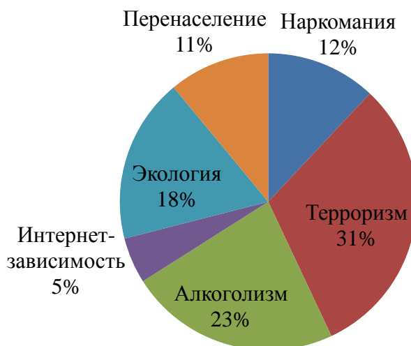
Рисунок 4 – Результаты анкетирования обучающихся 8-х классов по вопросу №6

В качестве глобальных проблем современности обучающиеся называли терроризм, перенаселение, наркомания, алкоголизм.