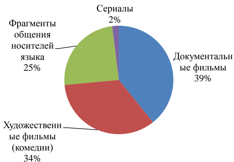
Рисунок 3 – Результаты анкетирования обучающихся 8-х классов по вопросу №3

О способах работы над видеофрагментами мнения разделились - обучающиеся хотят видеть видео как сопровождение к другому заданию (например, к розыгрышу диалога), как сопровождение к теме урока (например, если тема про школьную жизнь, то и видео должно быть про неё), как отдельный вид упражнения. Обучающиеся выразили мнение, что видео позволят разнообразить урок, особенно, если они комедийные, и позволят снизить нагрузку на мозг. Некоторые обучающиеся озаботились снижением продуктивности урока, если видео будет занимать много времени на уроке.