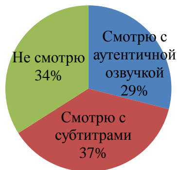
Рисунок 1 – Результаты анкетирования обучающихся 8-х классов по вопросу №1