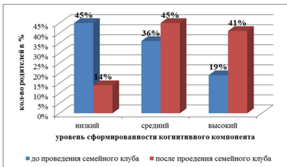
Рис 2. Сравнительная характеристика распределения родителей детей старшего дошкольного возраста по уровням сформированности когнитивного компонента педагогической компетентности родителей в сельской местности в условиях дошкольной образовательной организации до и после реализации семейного клуба «Мы команда»

Таким образом, можно сделать вывод, что большинство родителей до проведения семейного клуба имели низкий уровень сформированности когнитивного компонента педагогической компетентности (45%), который характеризуется тем, что представления респондентов о роли родителя очень общие, знания которые имеются о возрастных и психологических особенностях развития ребенка носят поверхностный и фрагментарный характер. Родители не имеют четкого представления о цели воспитания, выбирают ограниченный круг воспитательных методов авторитарного характера, содержание которых ограничивалось хозяйственно-бытовыми вопросами. Не интересуются специальной методической литературой по воспитанию и развитию детей дошкольного возраста. После реализации мероприятий в рамках семейного клуба «Мы команда» доминировать стал средний уровень сформированности когнитивного компонента педагогической компетентности (45%), который выражается в том, что родители обладают определенной осознанностью целей не только быть родителем, но и хорошим воспитателем ребенка, достаточно развита