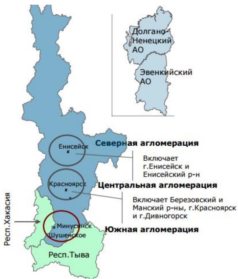
Рис. 1 – Карта южных районов Красноярского края