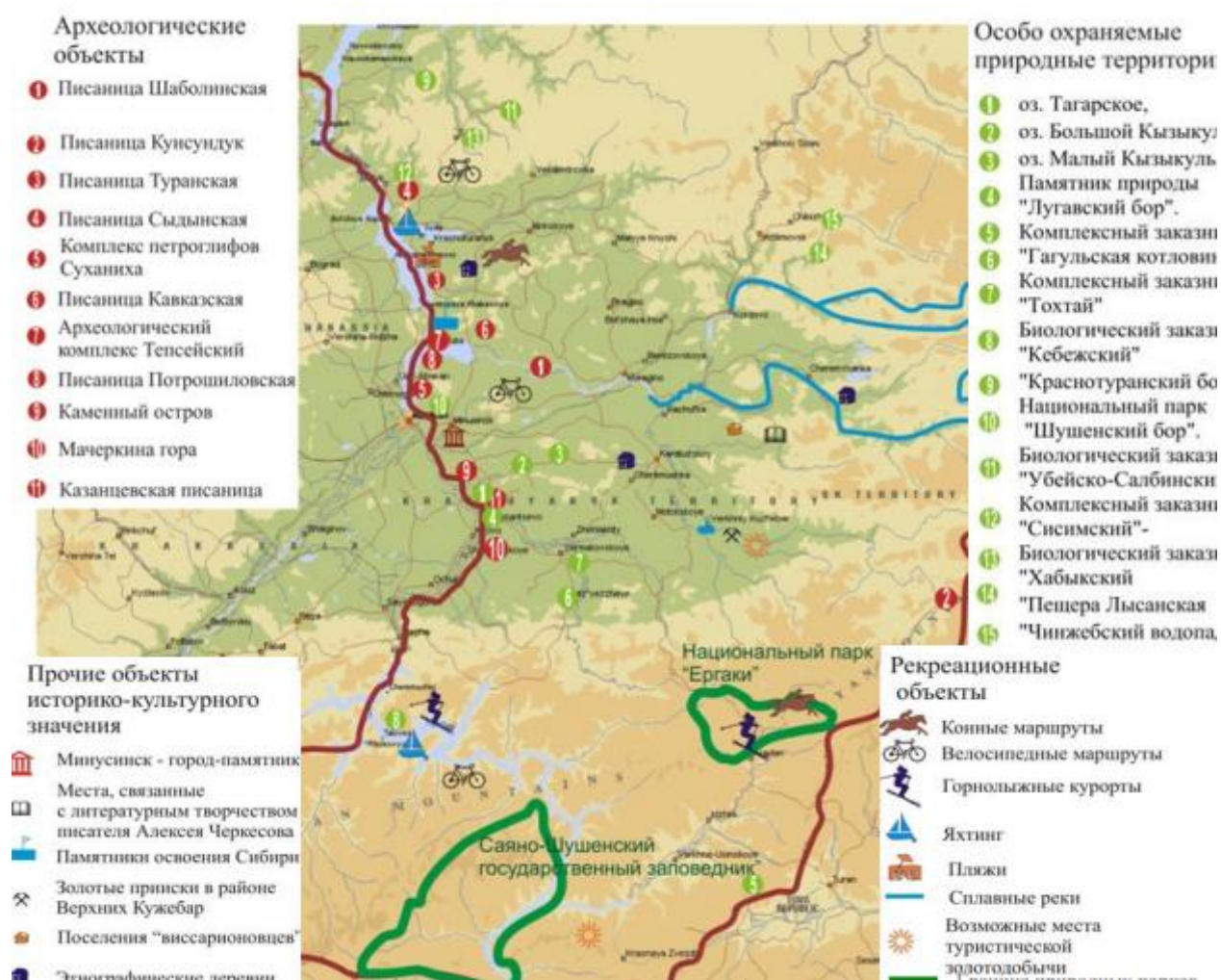
Рис.2 - Туристско-рекреационные ресурсы южных районов Красноярского края