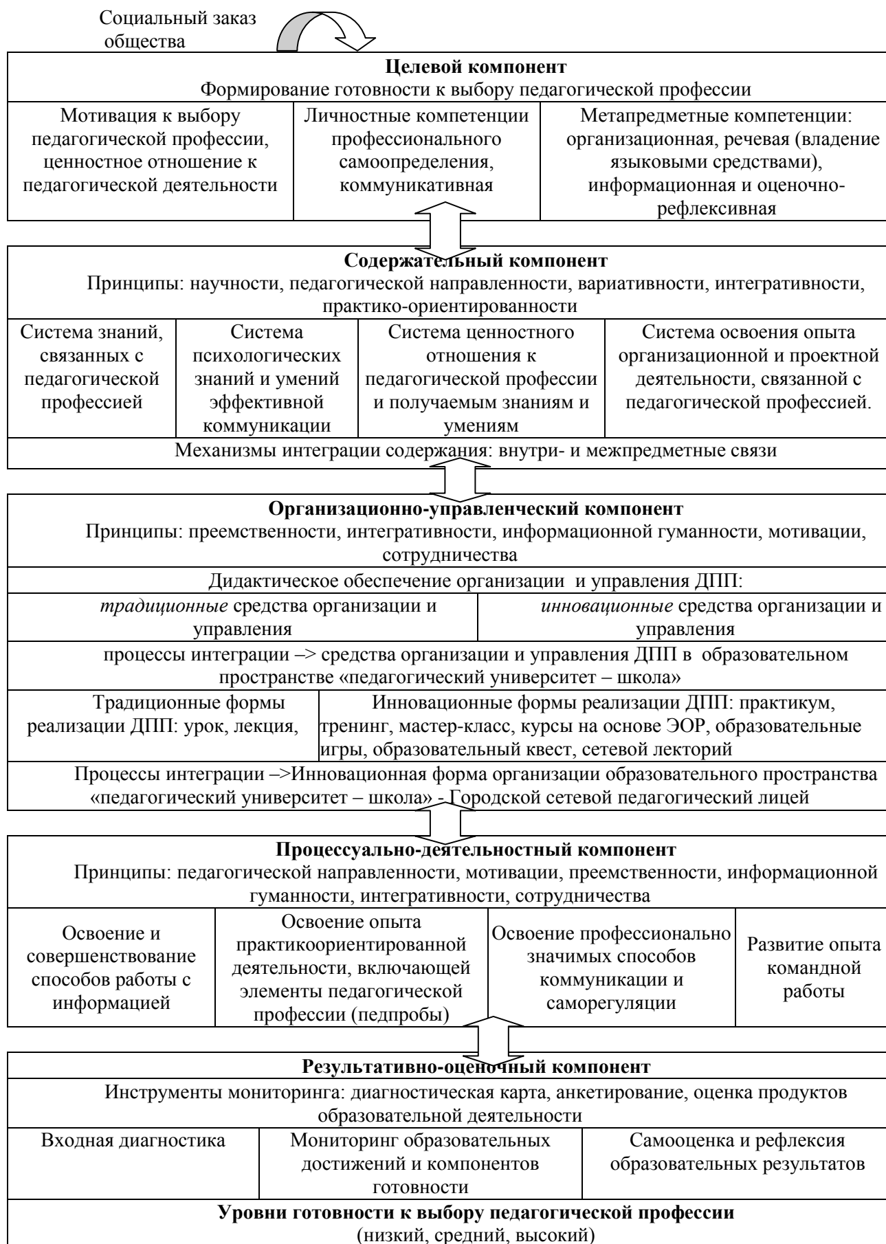
Рисунок 1. Модель формирования готовности к выбору педагогической профессии в образовательном пространстве «педагогический университет-школа»