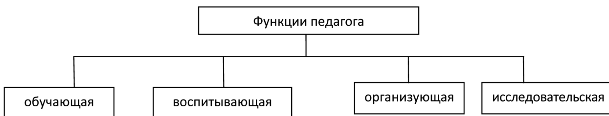
Рис. 1. Функции педагога при применении технологии кейс-стади

При этом в деятельности педагога выделяются сразу несколько функций, представленные на рис. 1.