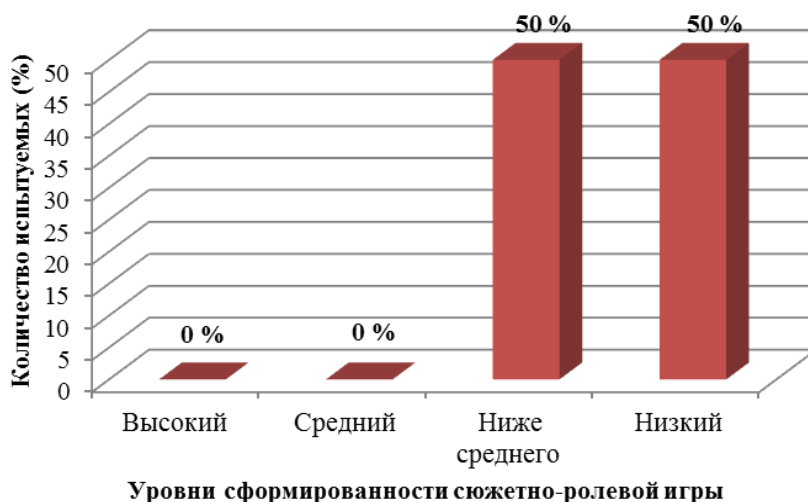
Рис. 3. Уровни сформированности сюжетно-ролевой игры у дошкольников с умственной отсталостью легкой степени (%).

50% (3 человека) дошкольников с умственной отсталостью легкой степени продемонстрировали уровень сформированности сюжетно-ролевой игры ниже среднего . В результате диагностики дети набрали от 29 до 40 баллов. Особенности игровой деятельности дошкольников с умственной отсталостью легкой степени схожи с особенностями дошкольников с ЗПР, показавшими уровень сформированности сюжетно-ролевой игры ниже среднего. Отличительными особенностями от детей с ЗПР на данном уровне являлись следующие: игровые действия дошкольники с легкой умственной отсталостью не сопровождали речью или вокализировали, выражая чувство удовольствия от выполняемых действий. Помимо этого, дети с умственной отсталостью играли, преимущественно, в предметные игры, выполняли только заученные действия в соответствии с каким-то одним сюжетом, демонстрируя крайне низкую способность к творчеству в игре.