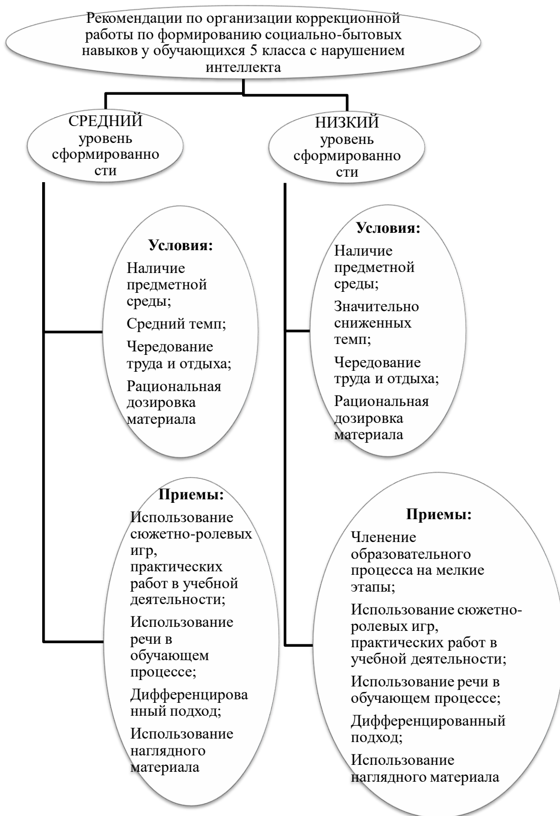
Рисунок 4 - Схема рекомендаций по организации коррекционной работы по формированию социально-бытовых навыков у обучающихся 5 класса с нарушением интеллекта для каждой отдельной группы