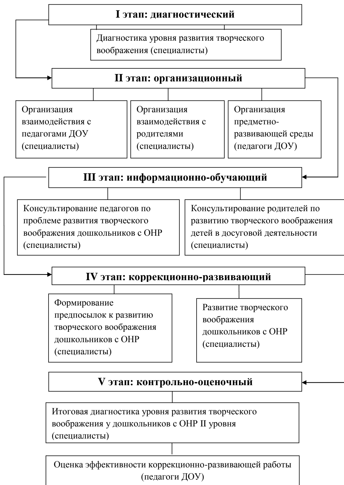
Рис. 3. Этапы работы по развитию творческого воображения у дошкольников пяти лет с ОНР II уровня.