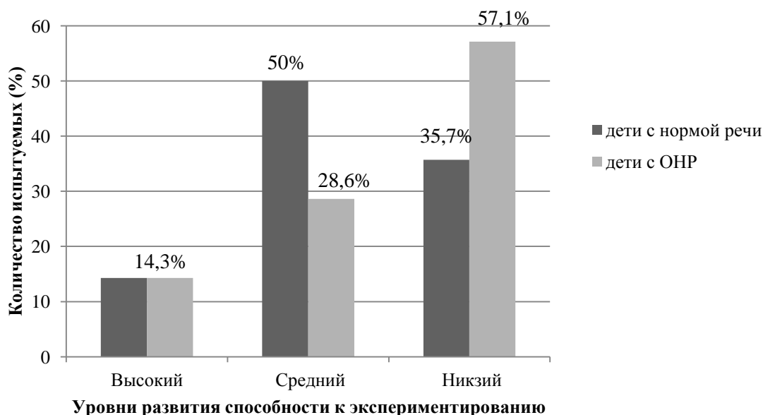
Рис. 2. Сравнительный анализ способности к экспериментированию у дошкольников пяти лет с нормой речевого развития и ОНР II уровня.

Как видно из гистограммы на рисунке 2, большинство дошкольников с ОНР (57,1%) проявили низкий уровень способности к экспериментированию с преобразующими объектами. Большинство же дошкольников с нормой речевого развития (50%) показали средний уровень. 28,6% дошкольников с ОНР показали средний уровень способности к экспериментированию, что на 21,4 % меньше, чем в группе дошкольников с нормой речевого развития. Количество детей с ОНР, показавших высокий уровень способности к экспериментированию, оказалось столько же, сколько и детей с нормой речи (14,3%).