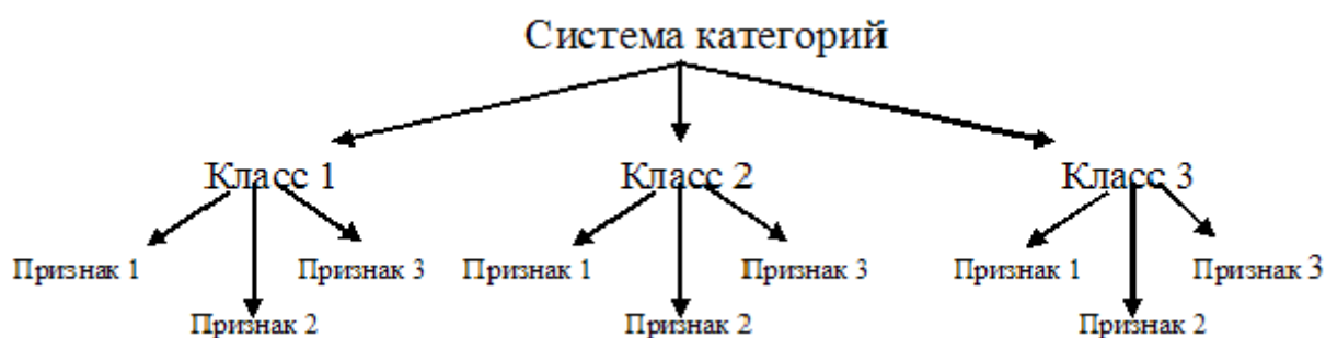
Рис. 1. Построение системы категорий

Система категорий состоит из нескольких классов, которые классифицируют различные типы наблюдаемых явлений. Для того, чтобы наблюдаемое явление по возможности однозначно было включено в тот или иной класс, необходимо точно определить признаки, характеризующие каждый класс (рис. 1).