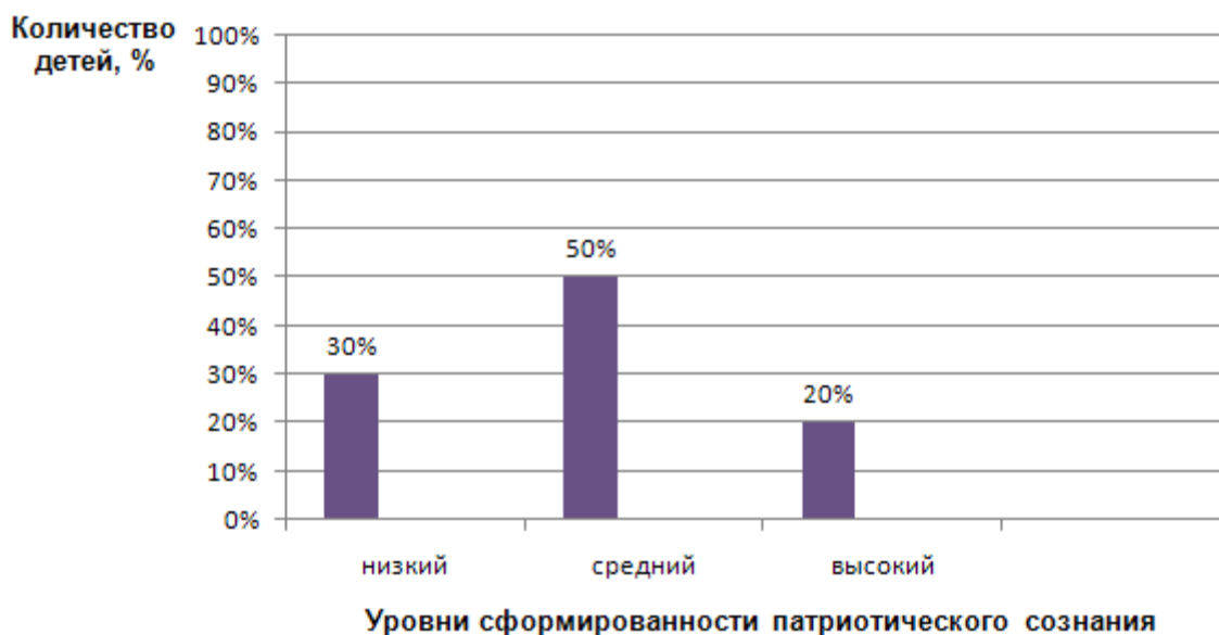
Рис. 3. Распределение детей экспериментальной группы по уровням сформированности патриотического сознания