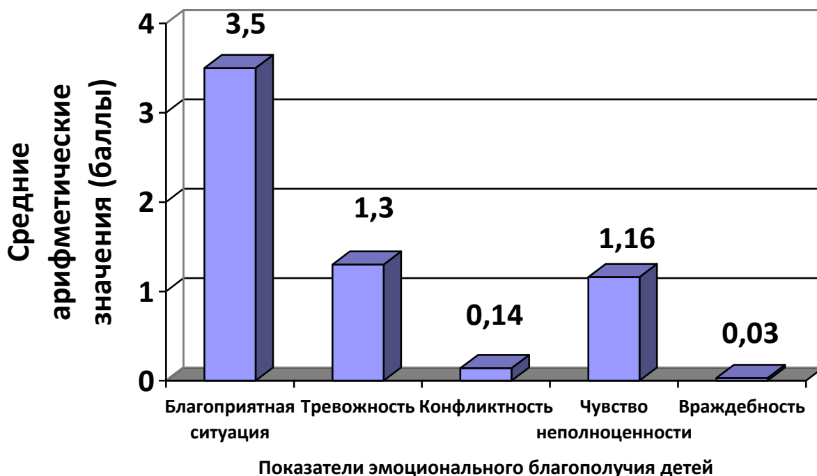
Рис.3. Выраженность показателей эмоционального благополучия детей (методика КРС)

Обобщенные результаты исследования представлены на Рис 3.