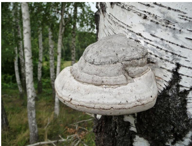
Рис.3. Трутовик настоящий на стволе березы

Группа порядков АФИЛЛОФОРОИДНЫЕ ГИМЕНОМИЦЕТЫ