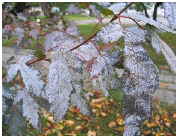
Рис. 2. Мучнистая роса на листьях растения

Царство ГРИБОПОДОБНЫЕ ОРГАНИЗМЫ– CHROMISTA Отдел АСКОМИКОТА, или СУМЧАТЫЕ ГРИБЫ – ASCOMYCOTA Класс ЭУАСКОМИЦЕТЫ, или ПЛОДОСУМЧАТЫЕ – EUASCOMYCETES Группа порядков ПИРЕНОМИЦЕТЫ – PYRENO MYCETI IDAE Порядок ЭРИЗИФОВЫЕ – ERYSIPHALES