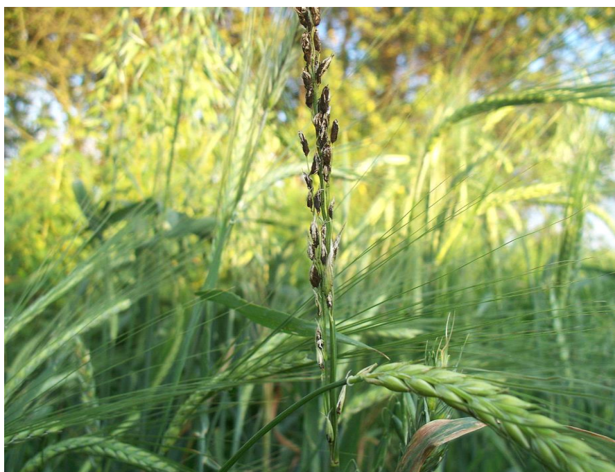
Рис. 4. Головня на плодах злаков