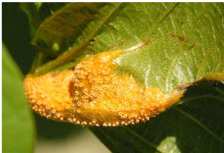
Рас.5. Ржавчинные грибы на листьях растения

Ржавчинные грибы – облигатные паразиты растений. Стадии их развития проходят на вегетативных органах живых растений, лишь зимние споры, в большинстве случаев находятся на отмерших частях растений (солومه, стерне, остатках листьев и т. п.).