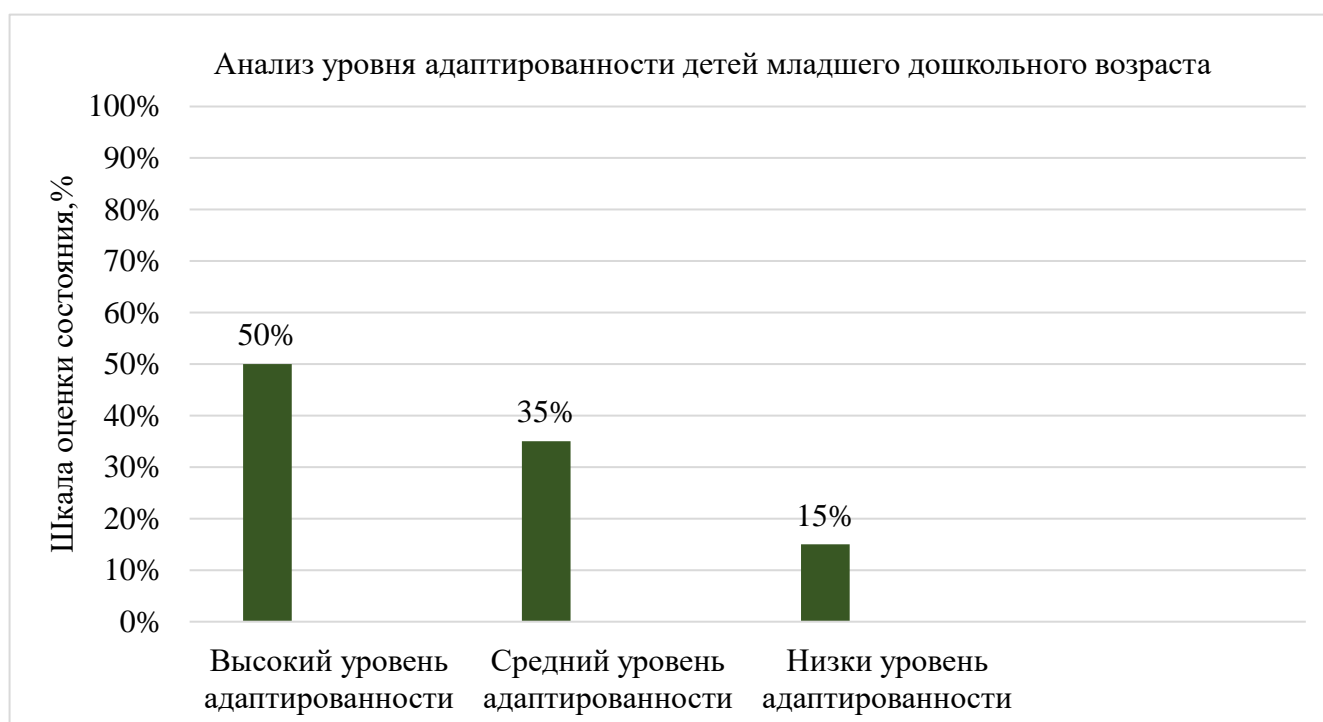
Рис. 1. Распределение выборочной совокупности детей младшего дошкольного возраста (1,5-3 лет) по показателям адаптации (по методике диагностики уровня адаптированности ребенка к дошкольному учреждению, автор — А.С. Роньжина), в %.

диаграммы на рис. 1, что позволило четко проследить распределение результатов по ключевым показателям адаптации, сравнить индивидуальные и групповые достижения, выявить общие тенденции в процессе привыкания детей к условиям дошкольной образовательной организации. Полученные данные продемонстрировали дифференцированное распределение участников исследования по четырем категориям адаптированности, что дало возможность объективно оценить общую эффективность процесса адаптации и выявить группы риска, требующие дополнительной нейропсихолого-педагогической поддержки.