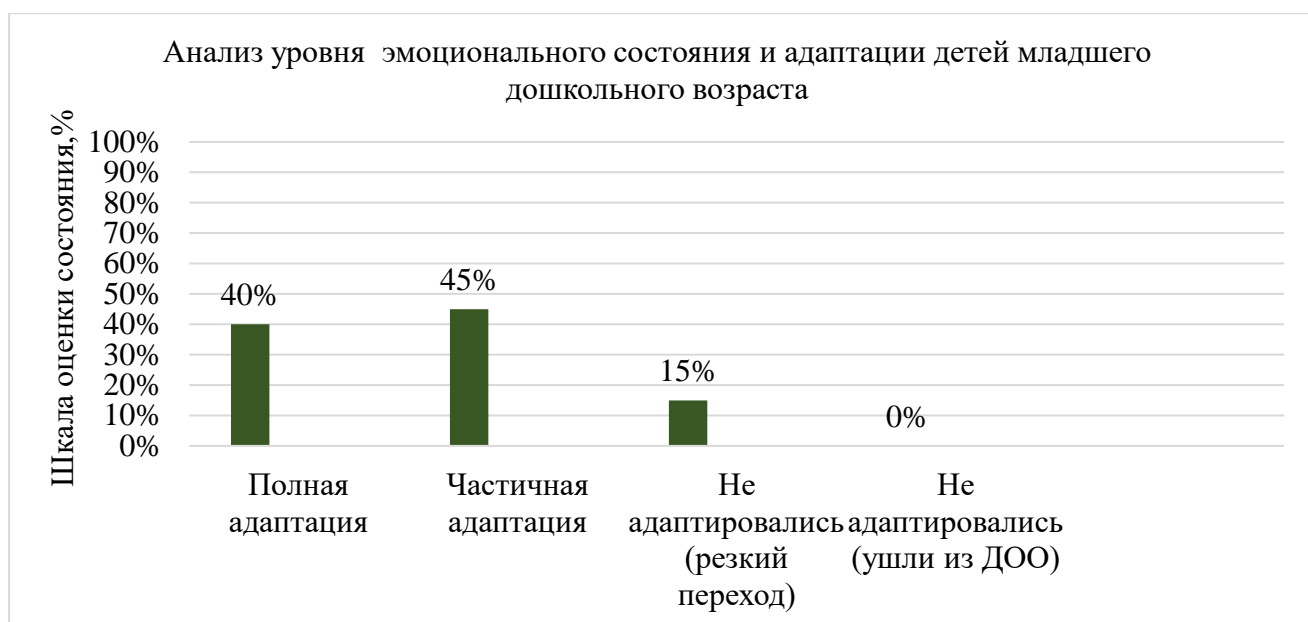
Рис. 3. Распределение выборочной совокупности детей младшего дошкольного возраста по показателям эмоционального состояния детей младшего дошкольного возраста (1,5–3 лет) с использованием адаптированной версии опросника К.Л. Печоры в %.

Анализ результатов внедрения программы «Вместе с мамой» (на основе принципов системы Монтессори) подтвердил ее высокую эффективность в адаптации детей младшего дошкольного возраста (1,5–3 лет) к условиям ДОО.