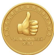
Рисунок 4 – жетон используемый в мероприятиях