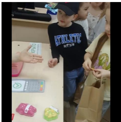
Рисунок 1 – фото с мероприятия