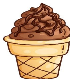
Рисунок 3 – рисунки продуктов используемые в 4 мероприятии