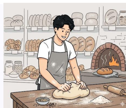
Рисунок 2 – рисунки профессий используемые в мероприятиях