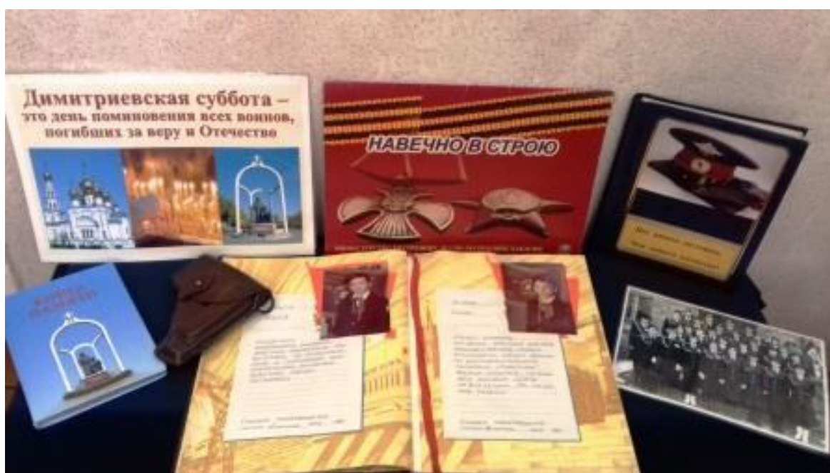
Рисунок 5. Экспозиция, посвященная ветеранам Великой Отечественной войны