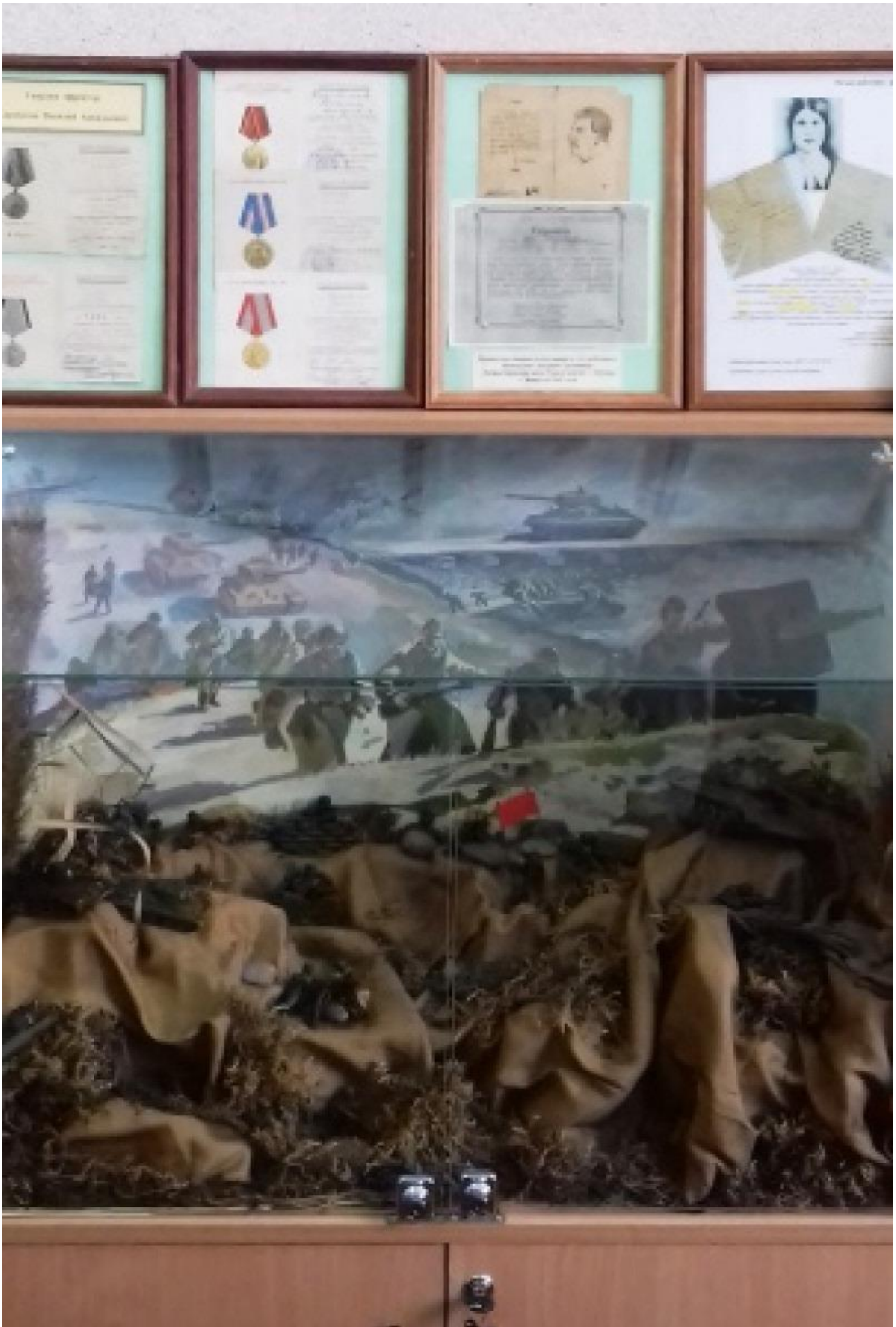
Рисунок 6. Экспозиция «Документы ветеранов Великой Отечественной войны».