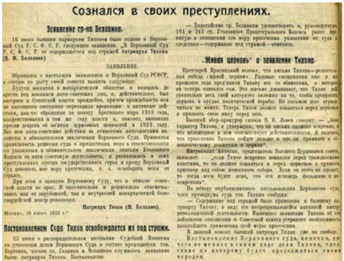
Рисунок 1. Сканированная копия страницы 317. «Сознался в своих преступлениях», журнал «Красная деревня», 1923 г.

В связи с арестом, был создан обновленческий церковный орган руководства (ВЦУ), призванное заменить Патриарха. В Москве при поддержке советских структур прошло несколько обновленческих «соборов». Это привело к нарушению управления епархиями, поскольку сам орган признавался не каноничным. Противостояние «обновленцев» и «канонников» есть основная полярность раскола. ВЦУ стал первым системным органом, направленным на церковный раскол 51 .