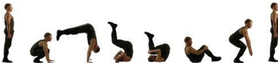
Рис. 17. Кувырок вперед.

Строевая стойка, упор присев, поставить руки вперед, наклоняя голову к груди, оттолкнуться ногами и, группируясь, выполнить перекат вперед в положение упор присев, встать.