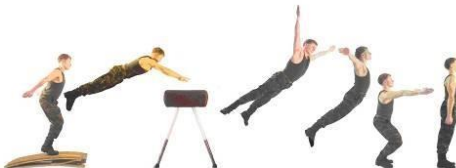
Рис. 12. Прыжок ноги врозь через козла в длину.

Прыжок выполняется с разбега, толчком ногами от мостика потянутся руками к опоре, поставить руки на нее, отталкиваясь развести ноги, руки вверх – в стороны, разгибаясь приземлиться.