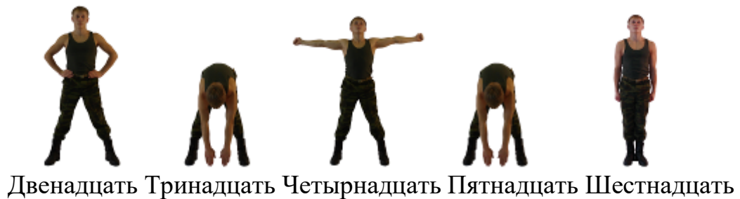
Рис. 1. Комплекс вольных упражнений № 1

Упражнение 2 Комплекс вольных упражнений № 2 (рис. 2). Выполняется на 16 счетов.