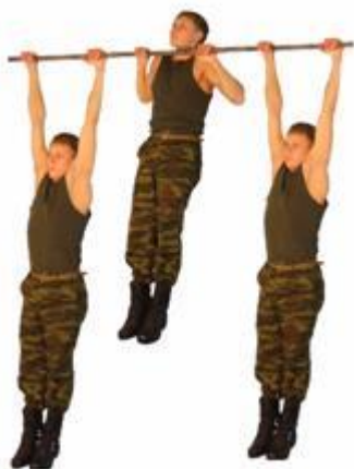
Рис. 4. Подтягивание на перекладине

Запрещается выполнение движений рывком и махом.