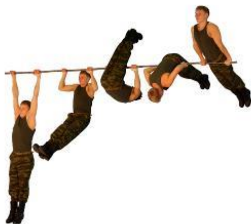
Рис. 6. Подъем переворотом на перекладине

Упражнение 7. Подъем силой на перекладине (рис. 7).