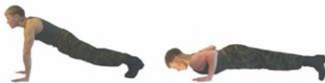
Рис. 16. Сгибание и разгибание рук в упоре лежа

Упражнение 17. Кувырок вперед (рис. 17).