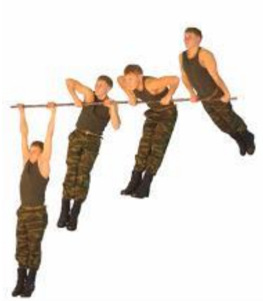
Рис. 7. Подъем силой на перекладине.

Упражнение 9. Сгибание и разгибание рук в упоре на брусьях (рис. 9).