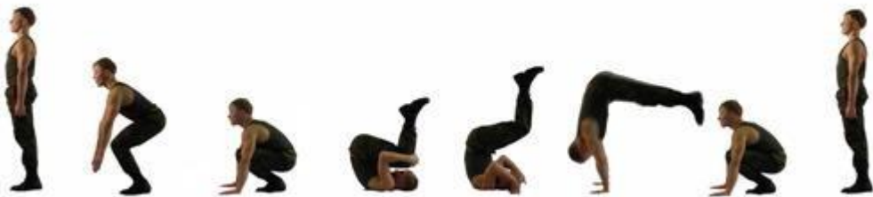
Рис. 18. Кувырок назад

Упражнение 19. Переворот в сторону (рис. 19).