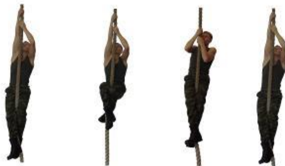
Рис. 20. Лазание по канату

Упражнение 21. Рывок гири (рис. 21). Вес гири 24 кг.