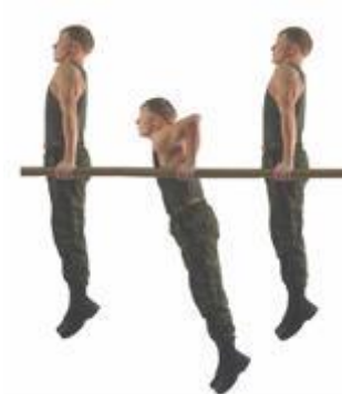
Рис.9. Сгибание и разгибание рук в упоре на брусьях

Упражнение 10. Угол в упоре на брусьях (рис. 10).