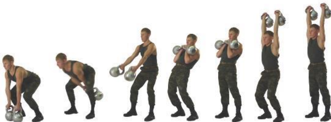
Рис. 22. Толчок двух гирь

Установлены две весовые категории: до 70 кг, 70 кг и выше.