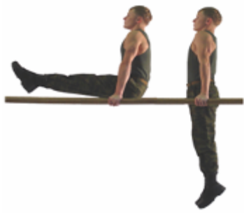
Рис. 10. Угол в упоре на брусках

Упражнение 12. Прыжок ноги врозь через козла в длину (рис. 12). Высота козла 125 см, мостик высотой 10-15 см., устанавливается произвольно.