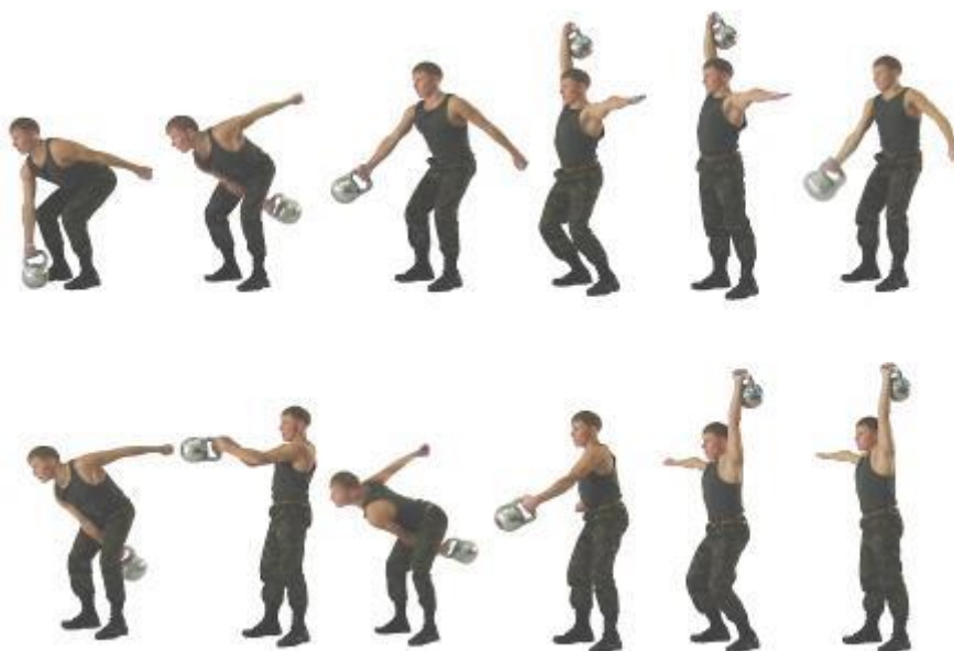
Рис. 21. Рывок гири

Установлены две весовые категории: до 70 кг, 70 кг и выше.