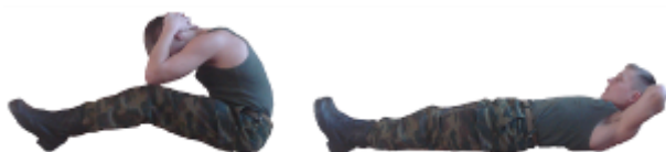
Рис. 15. Наклоны туловища вперед

Упражнение 16. Сгибание и разгибание рук в упоре лежа (рис. 16).