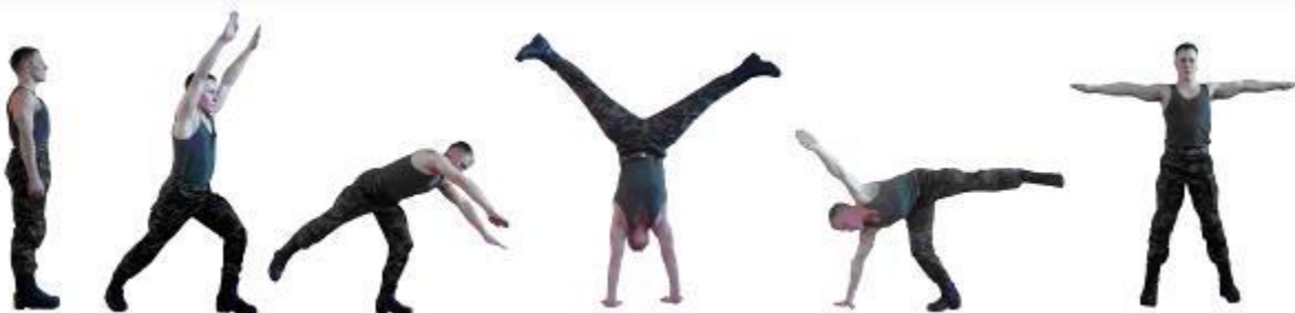
Рис. 19. Переворот в сторону.

Проводится в любом помещении или на ровной площадке.