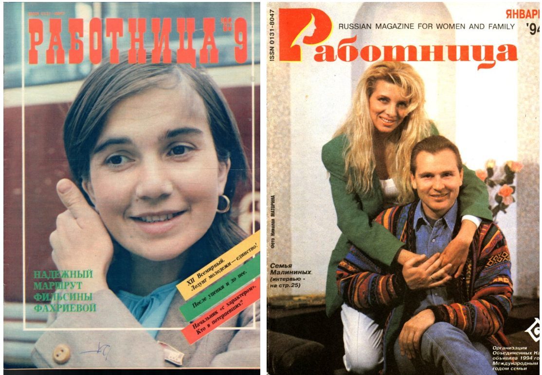
Рис.1 –Обложки журнала «Работница» за 1985 год и 1994 год