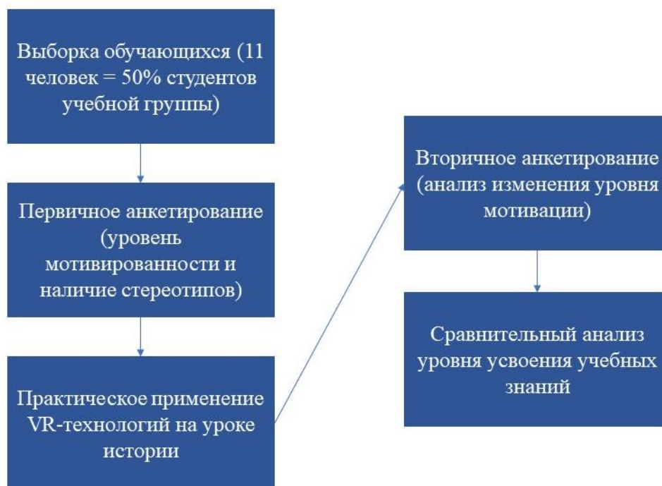
Рисунок 1. Механизм проведения эксперимента

Перед первичным использованием технологий виртуальной реальности обучающимся была предложена небольшая анкета, позволившая выявить исходный уровень мотивации по отношению к предстоящему иммерсивному опыту в рамках образовательного процесса и наличие у студентов стереотипов относительно виртуальной реальности. Вопросы в анкете были разработаны с учётом формирующего этапа эксперимента и позволили определить субъективное отношение обучающихся к внедрению VR-технологий в учебную деятельность для последующего сравнительного анализа изменений в мотивационной сфере участников уже после апробации применения технологий виртуальной реальности на уроках истории. Для выявления отношения студентов к предстоящему опыту и получения качественных оценок была использована классическая психометрическая шкала Ликерта «... в соответствии с рисунком 2».