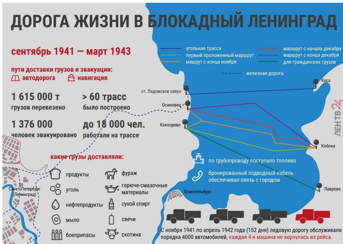
Рисунок 3. Инфографика «Дорога жизни в блокадный Ленинград»