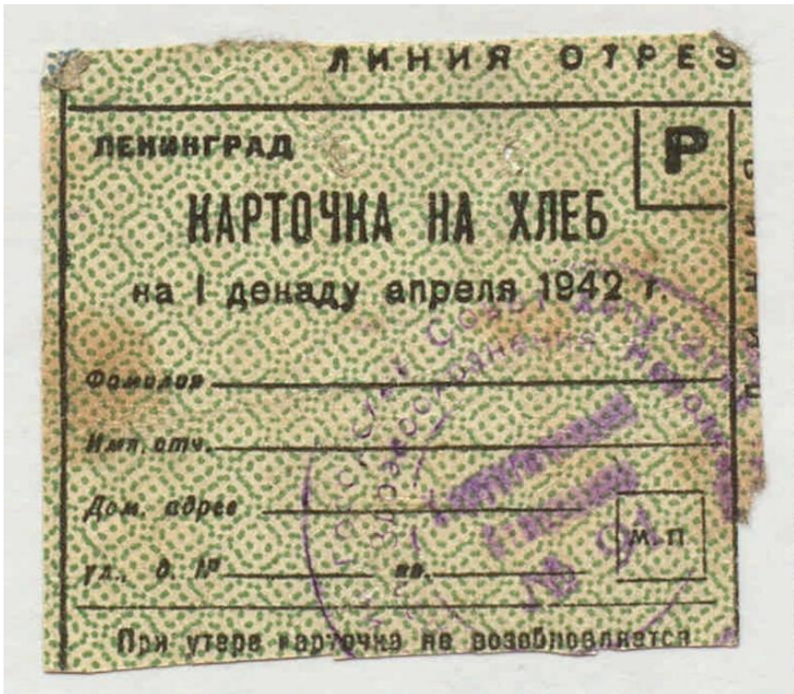
Рисунок 2. Хлебная карточка блокадного Ленинграда