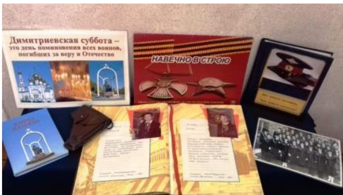
Рисунок 5. Экспозиция, посвященная ветеранам Великой Отечественной войны