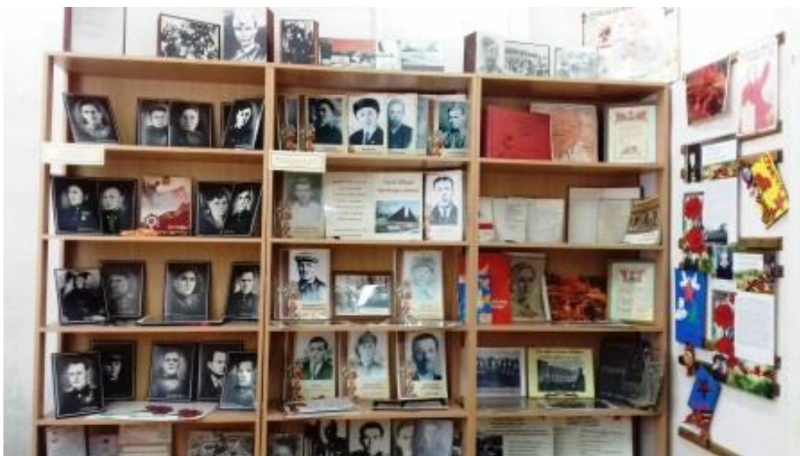
Рисунок 4. Стеллаж школьного музея