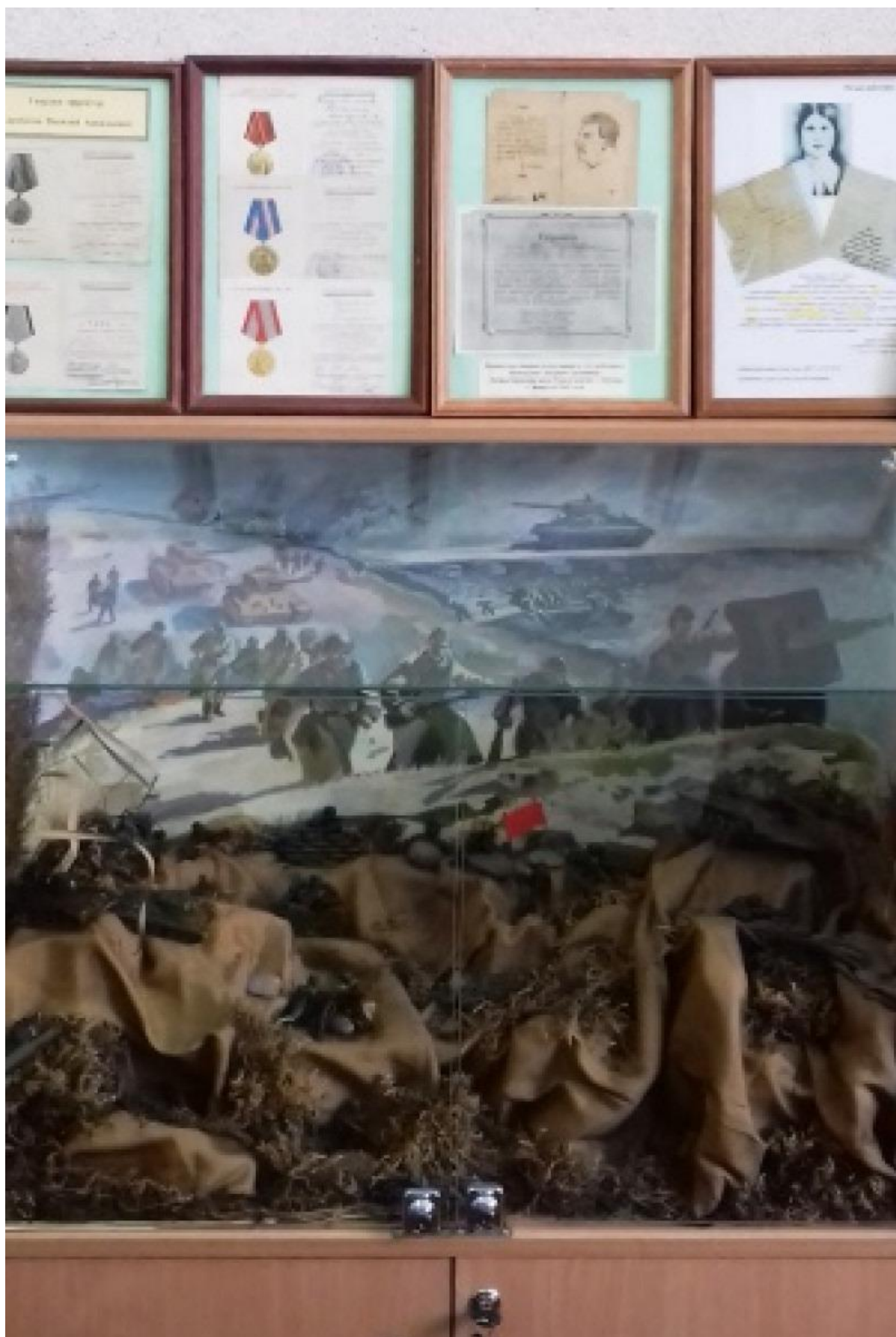
Рисунок 6. Экспозиция «Документы ветеранов Великой Отечественной войны».