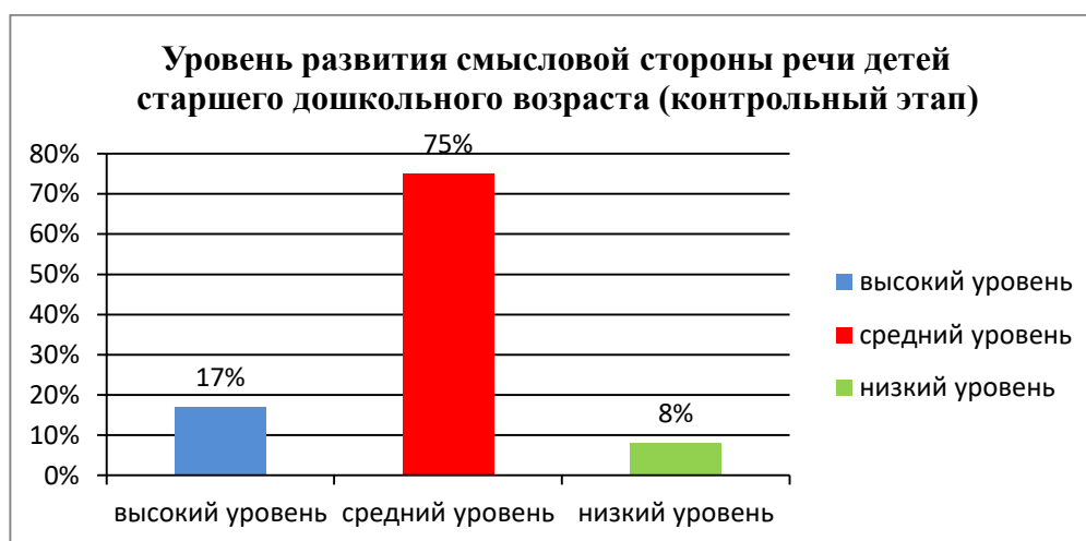
Рисунок 2. Результаты исследования уровня развития смысловой стороны речи детей старшего дошкольного возраста МКДОУ Детского сада «Х» по методике «Выявление понимания смысловых оттенков слова» (О.С. Ушаковой, Е.М. Струниной) (контрольный этап)

Вывод: анализ полученных результатов позволил нам определить уровень развития смысловой стороны речи детей старшего дошкольного возраста на этапе контрольного эксперимента: