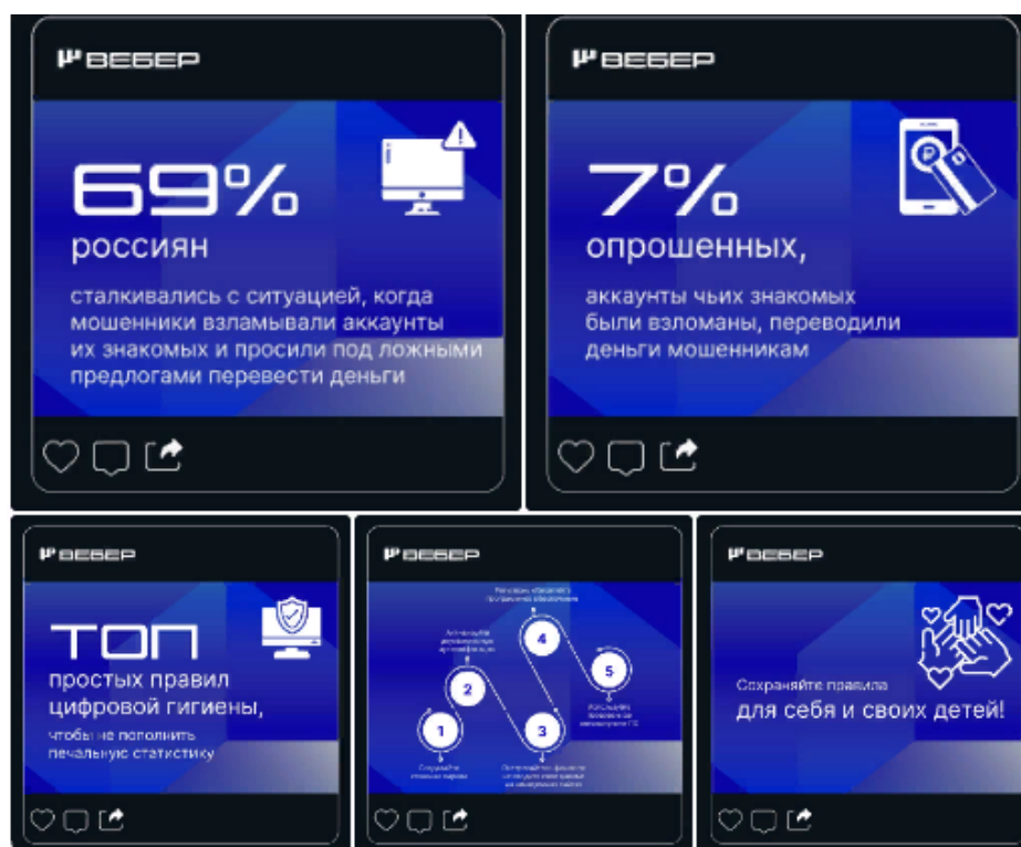
Рисунок 12 - Рекламный ролик на тему «Правила интернет-безопасности»

б) «создание «Моего этического портфолио» для каждого школьника: