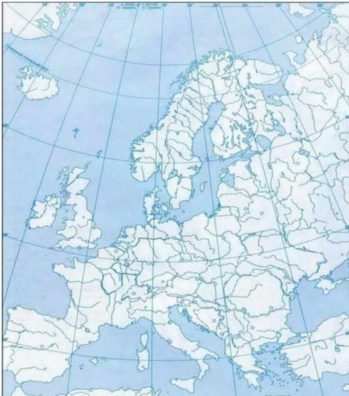
Рис.1 Географическое положение Европы