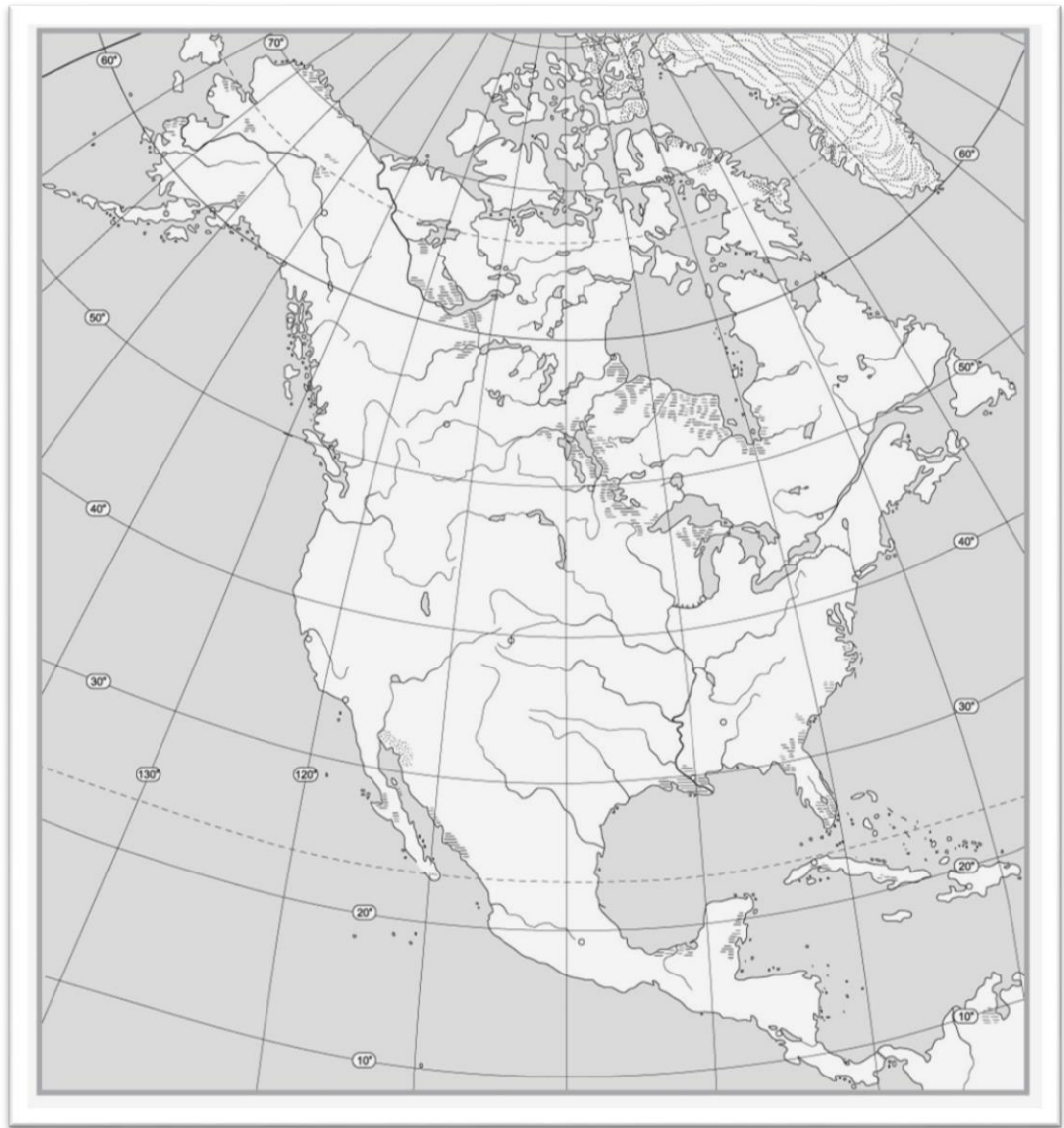
Рис.3 Географическое положение и рельеф Северной Америки