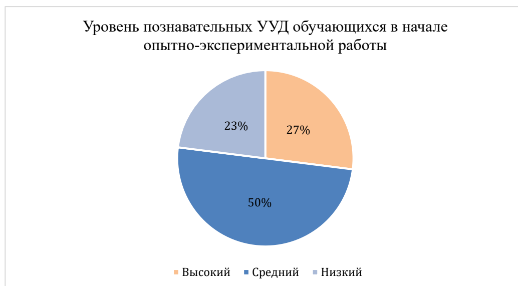
Рисунок 1 – Результаты диагностики сформированности уровня познавательных УУД у учащихся 7 «А» класса на начальном этапе опытно-экспериментальной работы

По итогам экспериментальной работы в результате использования аутентичных текстов для формирования познавательных УУД у учащихся 7 «А» класса на заключительном этапе мониторинга были получены следующие результаты: 6 учащихся (27%) имеют высокий уровень познавательных УУД. 5 учащихся (23%) имеют низкий уровень познавательных УУД. 11 учащихся (50%) имеют средний уровень познавательных УУД. Критерием оценивания уровня познавательных УУД у учащихся была оценка за выполнения задания по аутентичным текстам (табл.3).