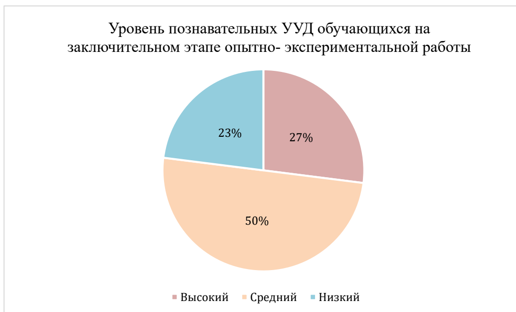
Рисунок 2 – Результаты диагностики сформированности уровня познавательных УУД у учащихся 7 «А» класса на заключительном этапе опытно- экспериментальной работы

недостаточного формирования познавательных УУД у учащихся на уроках английского языка.