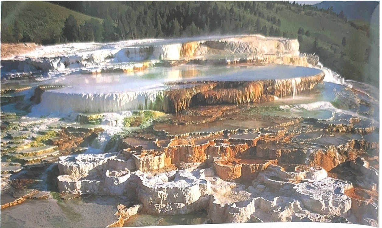
Minerva Terrace, Mammoth Hot Springs