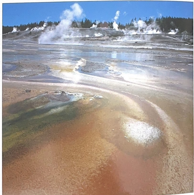
Africa Geyser, Norris Geyser Basin