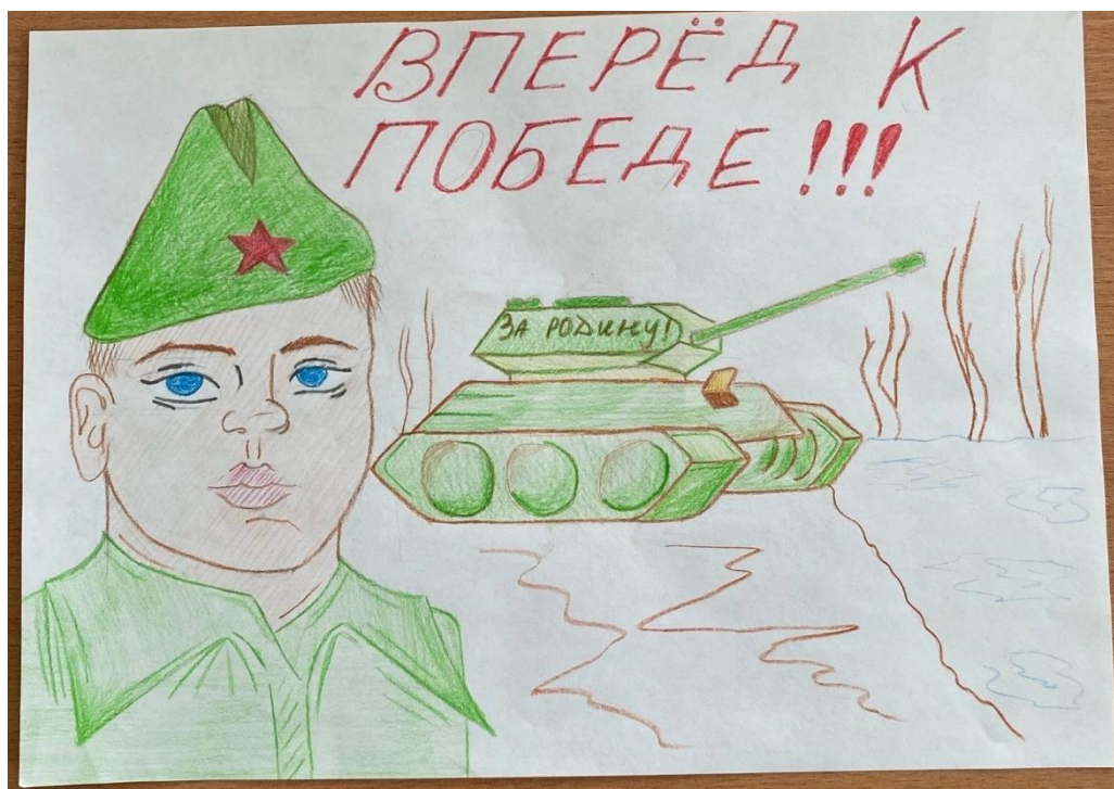
Рисунок 1 – Плакат ученика «Вперёд к победе!!!»

Результаты творческой работы учеников представлены на рисунках 1 – 4.