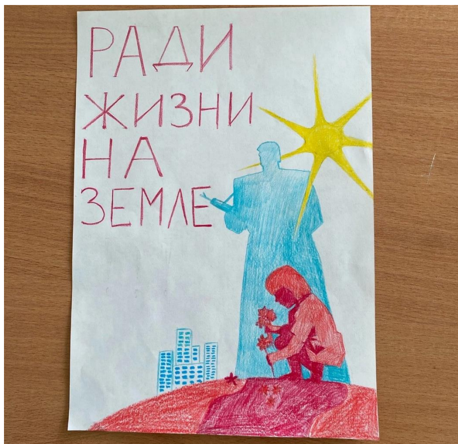
Рисунок 3 – Плакат ученика «Ради жизни на Земле»

Изображенная на рисунке 3 девочка, возлагающая цветы, является символом памяти и уважения к ветеранам и павшим в войне. Этот жест подчёркивает важность помнить и чтить жертв войны, и увековечивать память о тех, кто сражался и пожертвовал своей жизнью. Силуэт военного на заднем плане усиливает эту тему, представляя буквальное и символическое присутствие прошлого, которое по-прежнему оказывает влияние на настоящее, что подчеркивает непрерывную связь между прошлым и будущим поколениями.