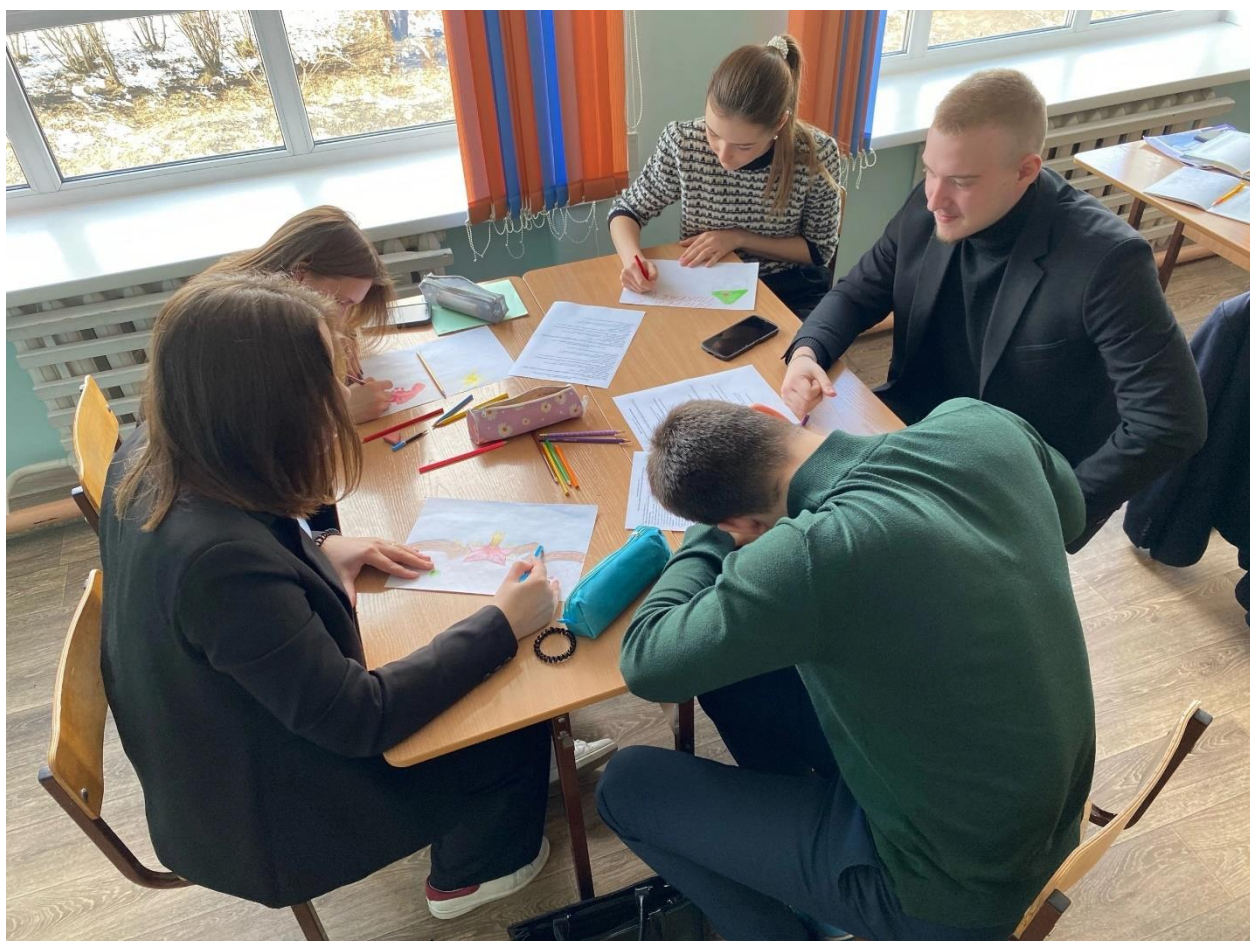
Рисунок 4 – Работа учеников над плакатами

По итогам мероприятия был проведен опрос для учеников, состоящий из 5 вопросов: