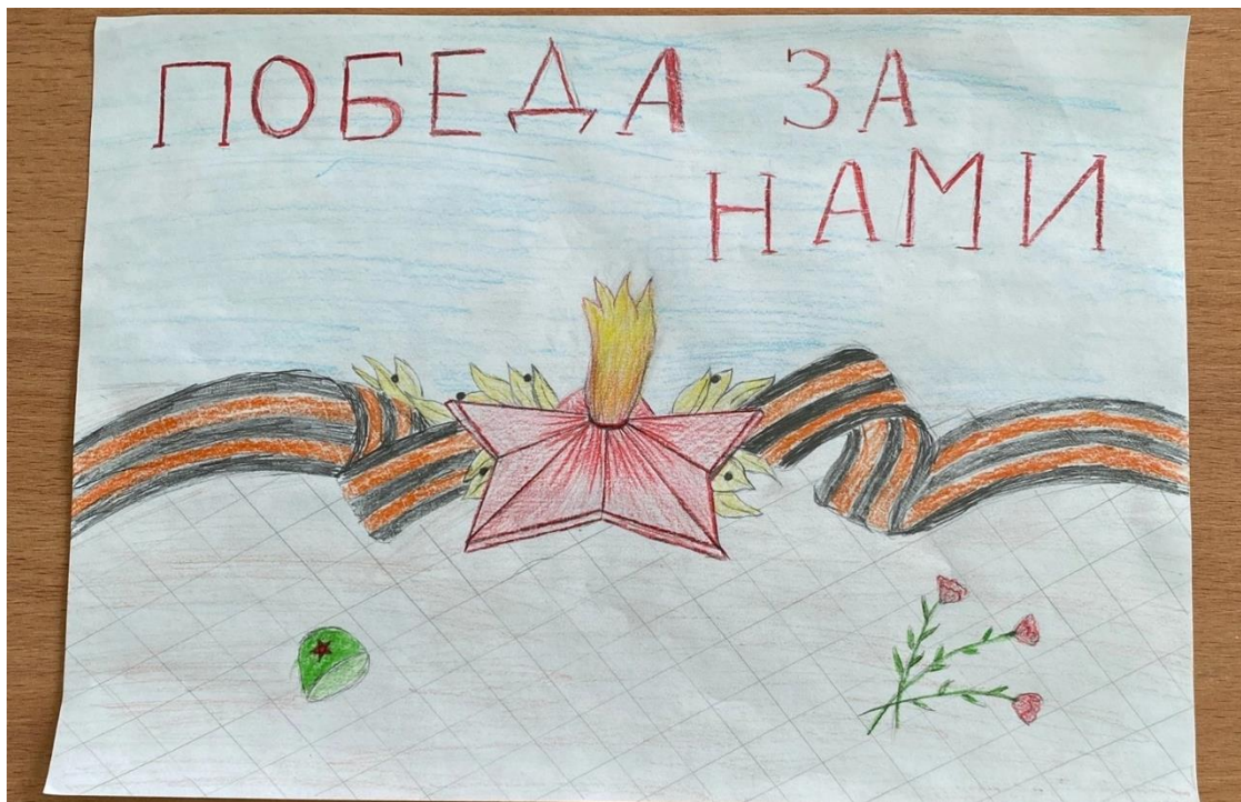
Рисунок 2 – Плакат ученика «Победа за нами»

направленность изображения. Рисунок хорошо демонстрирует характерные черты военной пропаганды: акцент на патриотизме, воодушевление на победу, и использование сильных, легко узнаваемых символов военной мощи (солдат, танк.)