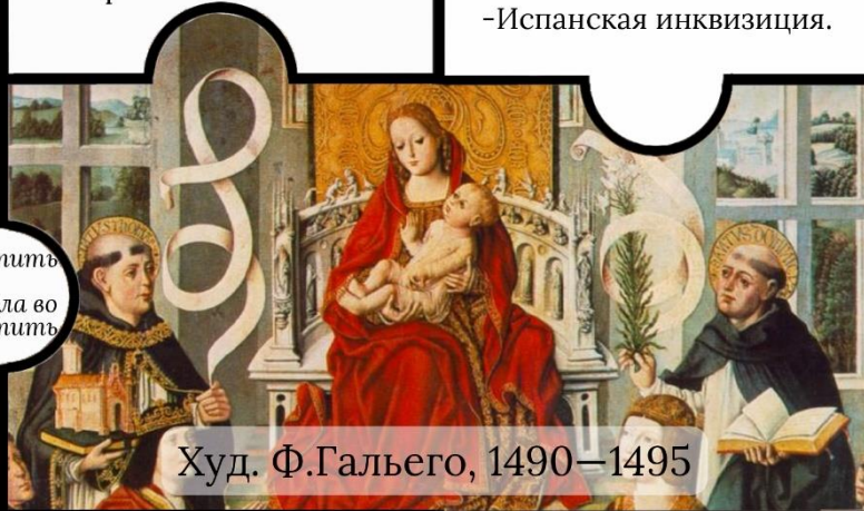
Худ. Ф.Гальего, 1490–1495

Из книги Генри Хаггарда "Копи царя Соломона. Прекрасная Маргарет": «Подчинить своей власти всю Европу; сокрушить мавров и захватить их земли; добиться того, чтобы Христова церковь восторжествовала во всем мире; искоренить ересь; обратить всех евреев в христианскую веру или уничтожить их... предать тела их очистительному огню, а богатство – своей казне. Таким путем она думает заслужить благодарность всех верующих на земле и престол в раю»