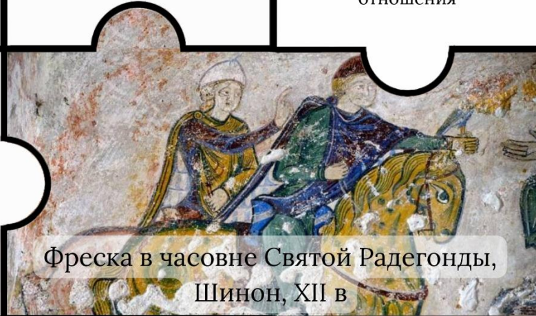
Фреска в часовне Святой Радегонды, Шинон, XII в

Монах Ричард Девизский, (конец XII в.): «Несравненная женщина, красивая и целомудренная, могущественная и умеренная, скромная и красноречивая — наделённая качествами, которые крайне редко сочетаются в женщинах»