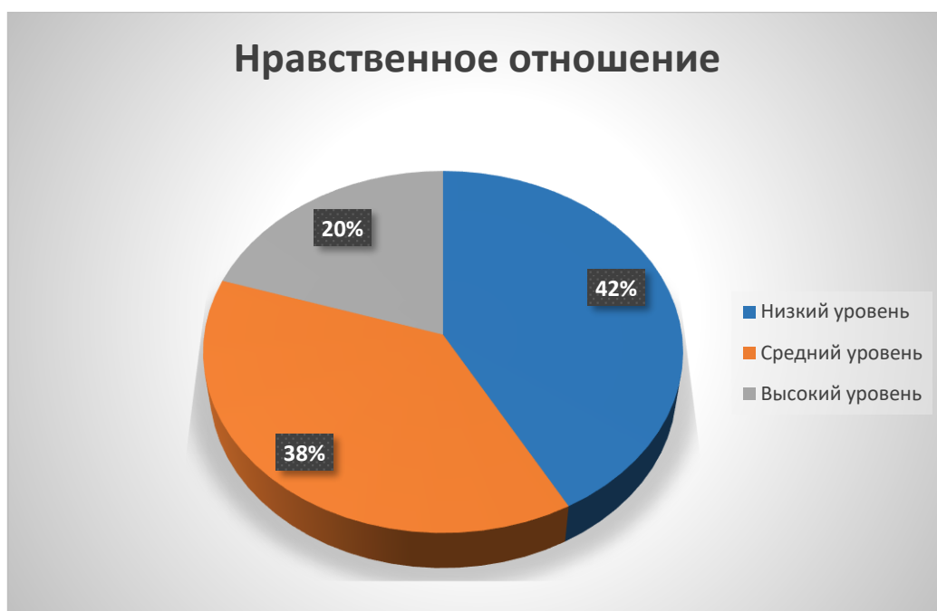
Диаграмма 2. «Как поступать» И.Б. Дермановой