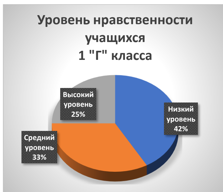
Диаграмма 4. Результаты диагностической программы