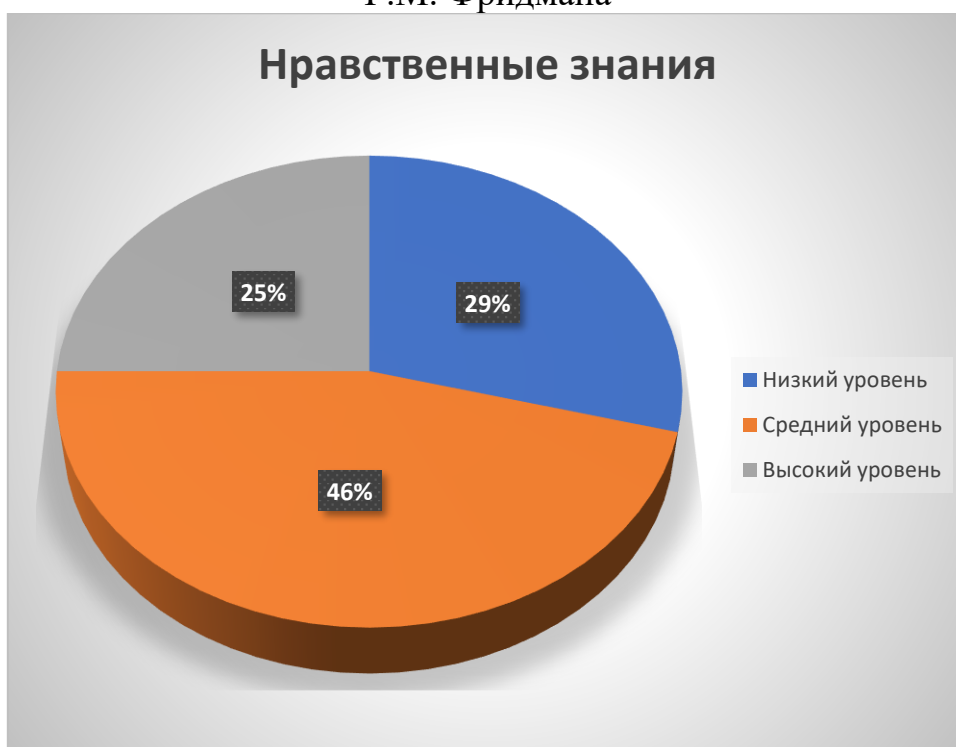
Диаграмма 1. «Что такое хорошо и что такое плохо?» Г.М. Фридмана

Второй этап диагностики: нравственное отношение. Проводился по методике «Как поступать» И.Б. Дермановой. [Приложение 2]