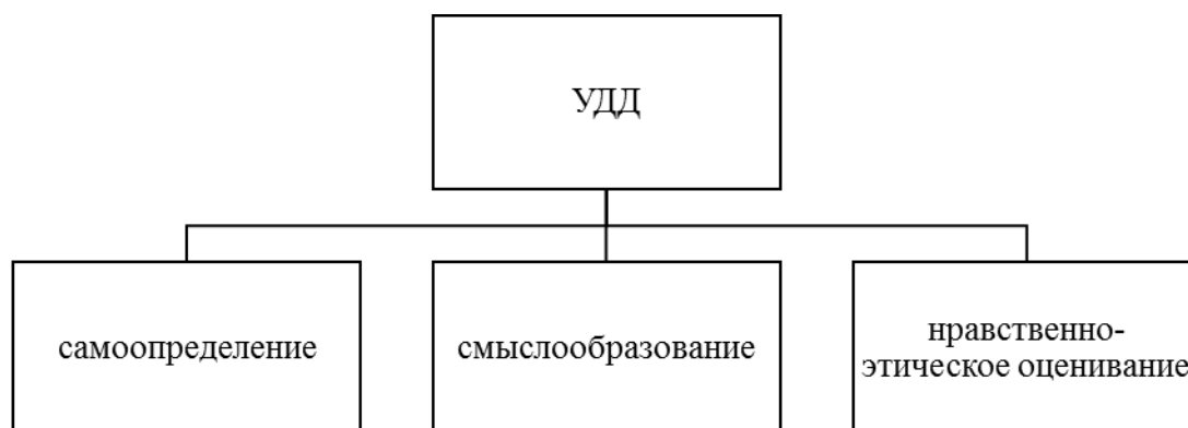
Рис.2. Личностные УУД [46]

Личностные УУД делят на 3 блока (см. рис.2).