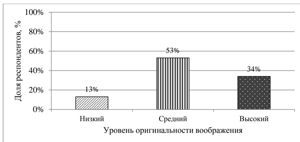
Рисунок 3. Распределение респондентов по уровню оригинальности воображения, %

Как видно из Рис. 3, в выборке присутствует следующее распределение респондентов по уровням оригинальности воображения: