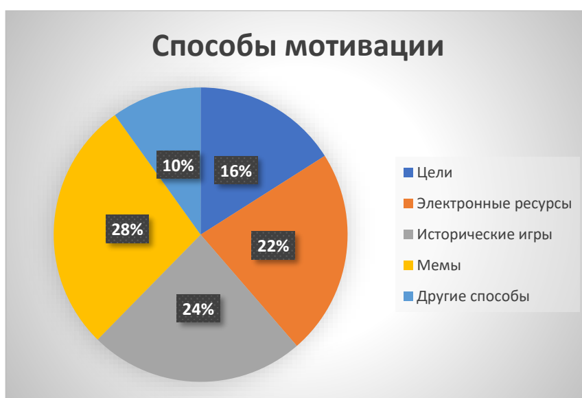
График 1. Анкетирование среди обучающихся 8 класса

Кроме того, школьникам предоставилась возможность при желании указать дополнительные способы мотивации. Результаты анкетирования можно увидеть на графике.