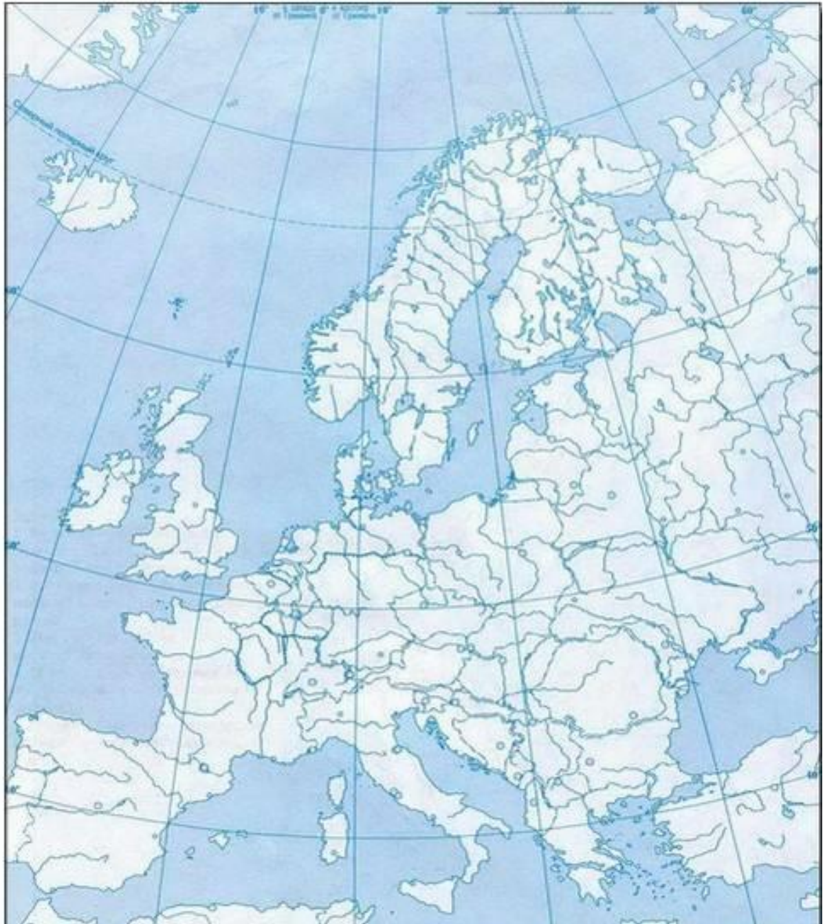
Рис.1 Географическое положение Европы