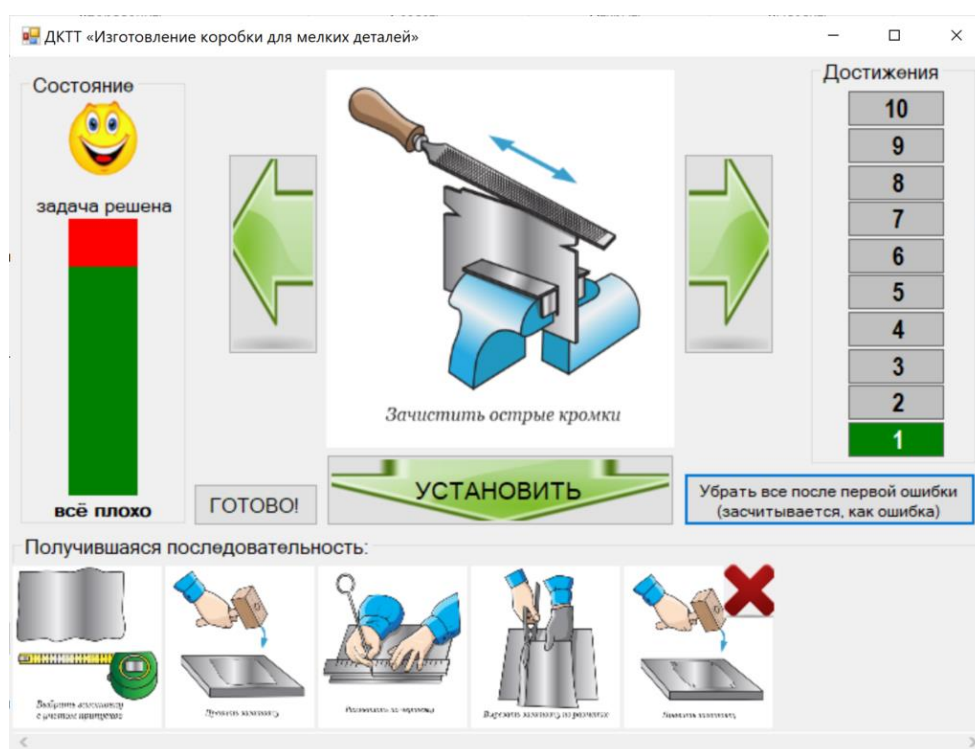
Рис. 2 – ДКТТ «КОНСТРУИРОВАНИЕ ПОСЛЕДОВАТЕЛЬНОСТИ»

Сценарий этого типа применим в самом широком спектре предметных областей. На рисунке 2 представлена задача построения последовательности технологических операций для изготовления коробки для мелких деталей начиная от выбора заготовки и заканчивая окончательной обработкой и покраской. Для обучающихся старших классов подобные задания можно строить в вербальной форме (рис. 2) без зрительных образов, что заметно упрощает процесс подготовки дидактического материала и сокращает сроки изготовления ДКТТ.