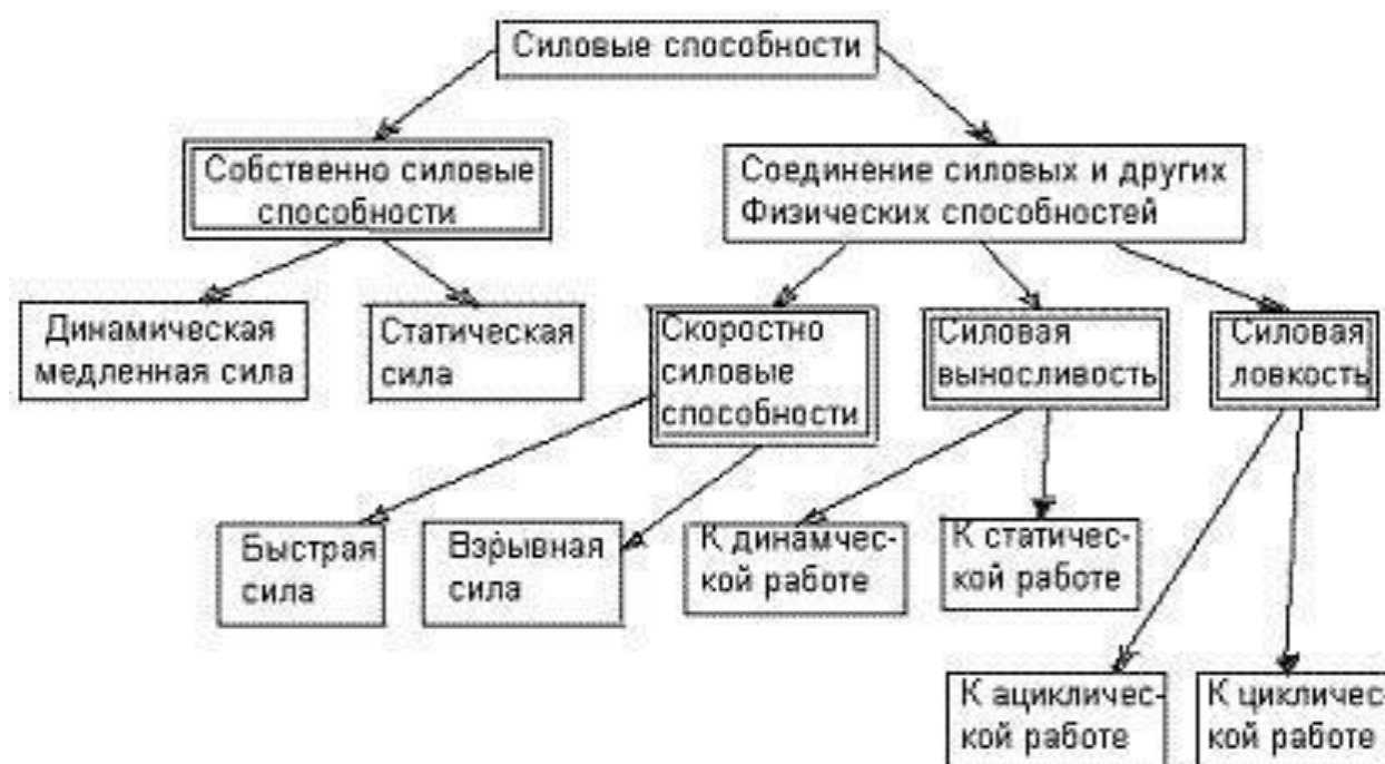
Рисунок 1 – Типы (виды) силовых способностей