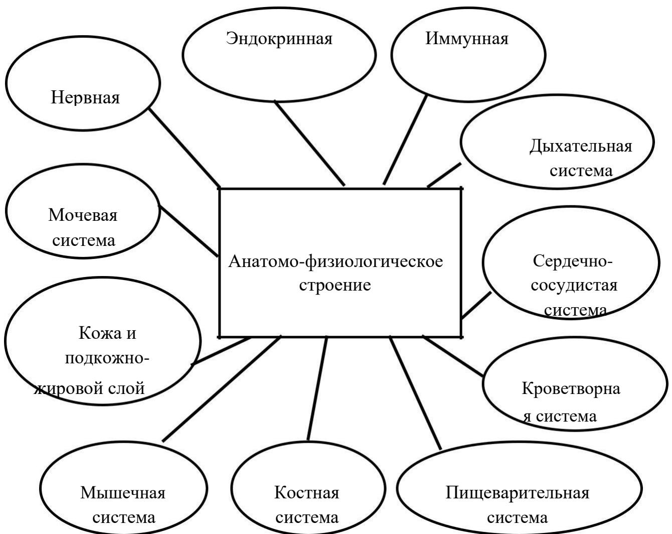
Рисунок 3 – Анатомо-физиологическое строение человека

Каждому возрастному периоду характерны ярко выраженные, специфические особенности, характеризующие совокупность специфических закономерностей развития. Смена периодов происходит скачкообразно. Периоды ускоренного развития сменяются периодами замедления. Особенности развития ребенка в последующий период имеют количественные и качественные отличия от предыдущего. Знание особенностей возрастной периодизации необходимо для правильного построения индивидуальной программы физической реабилитации ребенка, имеющего отклонения в состоянии здоровья. На рисунке 3 представлено схематически анатомо-физиологическое строение человека.