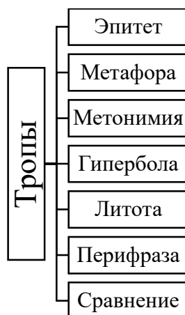
Рис. 2. Тропы в качестве средств художественной выразительности

фигуры являются непривычными оборотами, нарушающими языковые нормы и употребляемые для украшения речи за счет расширения образно-выразительной функции речи. Существуют различные виды тропа, так как принципы сближения многообразных предметов и явлений различны. Далее рассмотрим основные средства языковой выразительности в поэтических произведениях (рис. 2).