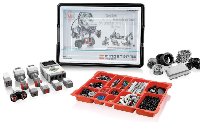
Рис. 2. Базовый набор Lego Mindstorms