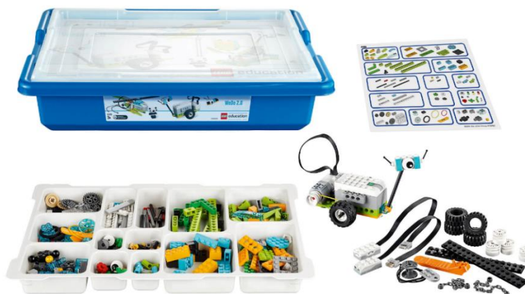
Рис. 1. Базовый набор LegoWeDo