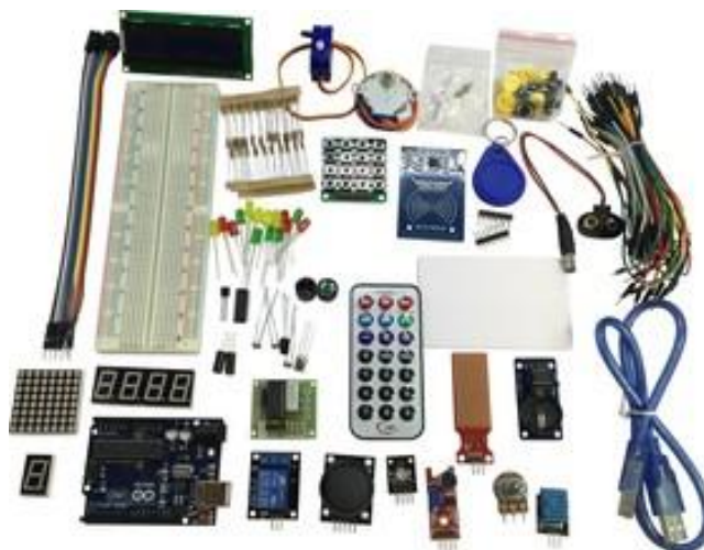
Рис. 3. Стартовый набор Arduino

применяется для создания электронных устройств с возможностью приема сигналов от различных цифровых и аналоговых датчиков, которые могут быть подключены к нему, и управления различными исполнительными устройствами [17].