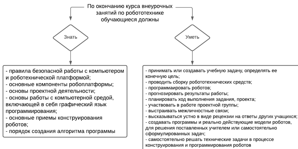
Рис.6. Прогнозируемые результаты программы внеурочных занятий по робототехнике