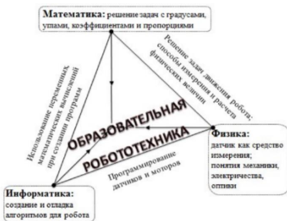
Рис. 4. Интегративные связи образовательной робототехники

Предполагает активное использование межпредметных связей при освоении новых знаний, например, между такими дисциплинами, как: математика, информатика, физика (Рис.4). Из интересного обзора по этой теме (Benitti, 2012), который проанализировал десять соответствующих статей, извлеченных из библиографических баз данных, следует, что содержание занятий по робототехнике в основном связано с областями физики и математики (80%). Дети знакомятся с такими понятиями как расстояния, углы, кинематика, график, дроби и многие другие. Но не стоит забывать, что при выполнении заданий они прокачивают навыки решения проблем, логику, изучение научной методологии.