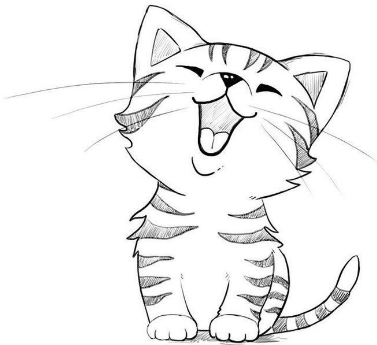
Рисунок 2 – Карточка для игры «What is next?»