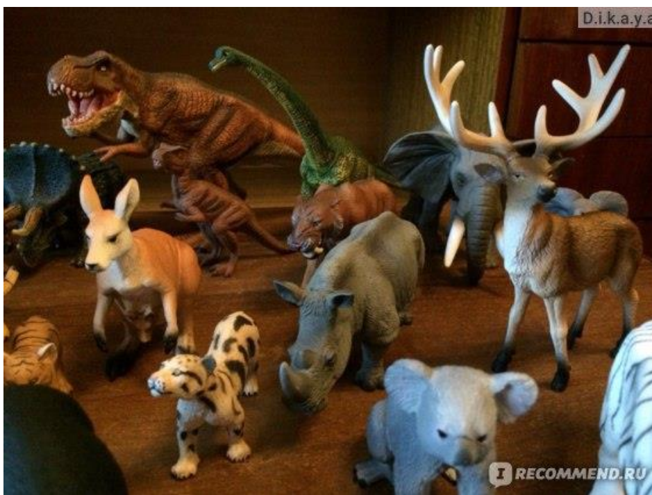
Рисунок 4 – Фигурки животных для игры «Find the treasure»