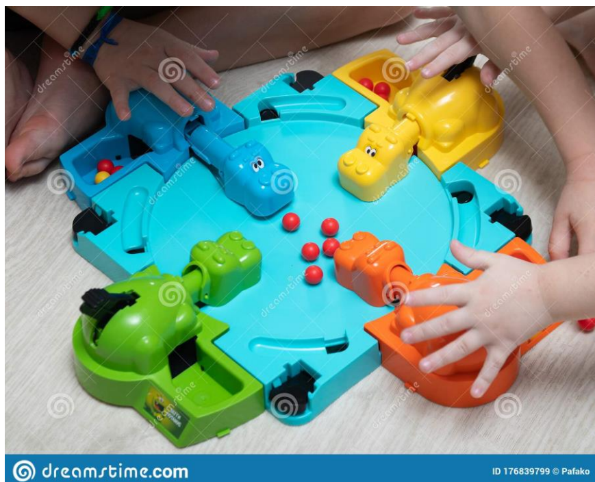
Рисунок 3 – Организация игры «Eat the balls»