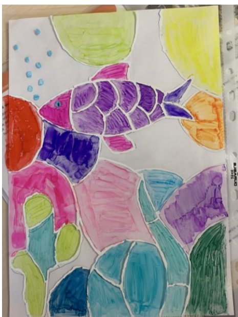
Рисунок 6 – Пример игры «Paint me»