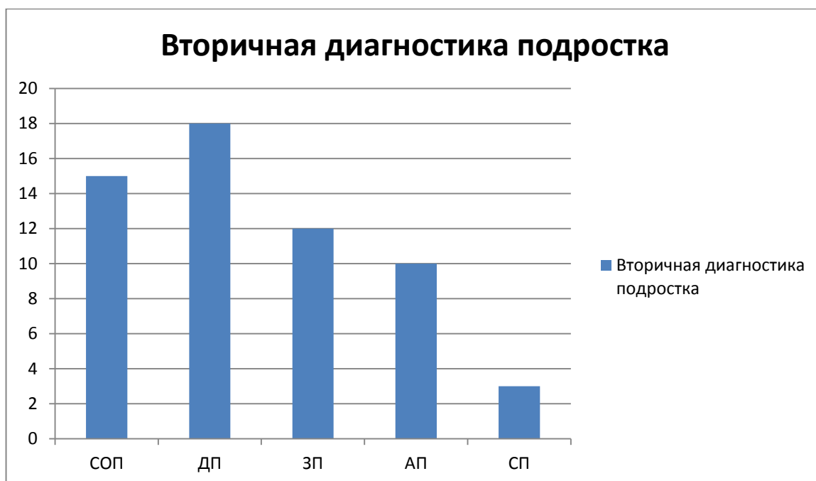
Рисунок 3 — Результаты повторной диагностики подростка.

Исходя из выше представленных результатов, можно сделать следующие количественные выводы: