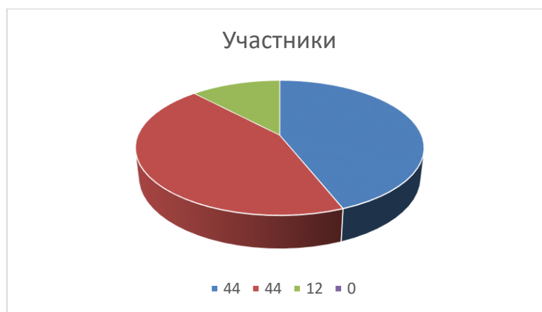
Рисунок 1 - Результаты исследования деятельностного компонента сформированности нравственных представлений по методике «Сюжетные картинки»

Обработка представленных данных показала 2 уровень эмоционального отношения 44% нравственных норм, ребенок правильно раскладывает картинки, обосновывает свои действия, эмоциональные реакции в норме, но выражены слабо. Дети правильно называют чувства людей изображенных на картинках, но не могут объяснить эту причину. К 1 уровню сформированности эмоционального отношения нравственных норм, относится 12% детей. При этом уровне для ребенка характерны трудности обоснования своих действий, у него эмоциональное проявление не выражены при оценке данных поступков. Ребенок не может соотнести настроение с конкретной ситуацией, объяснить их. К 3 уровню процент равен – 44%. Для этого уровня характерно, что ребенок правильно раскладывает каринки, при этом объясняя свой выбор. Старшем дошкольном возрасте – называют моральную норму, эмоциональные реакции на те или иные поступки героев ситуации адекватные, яркие. Нулевой уровень данной категории детей здесь не был выявлен.