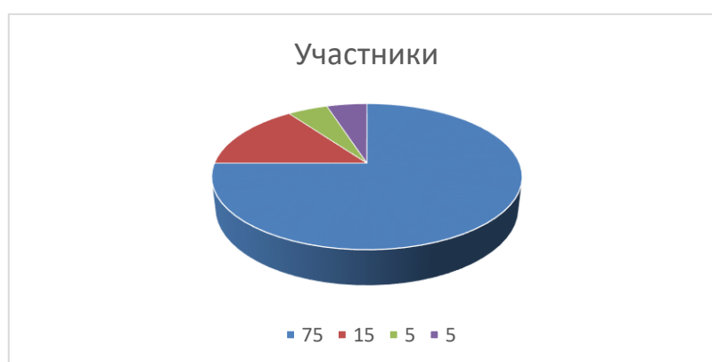
Рисунок 3 - Результаты анализа старших дошкольников по методике «Каков ребенок во взаимоотношение с окружающими детьми»

Данные таблицы представлены ниже в виде круговой диаграммы