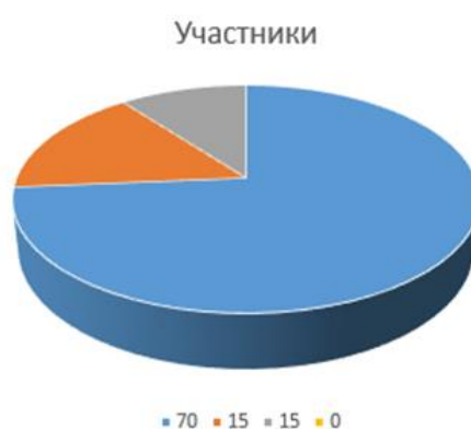
Рисунок 5 - Контрольные результаты исследования деятельностного компонента сформированности нравственных представлений по методике «Закончи историю»

В ходе диагностики мною было определено, что большинство участников исследования (70%) характеризуются достаточным уровнем осознанности нравственных норм. Мы можем говорить о том, что данные дети называют нравственную норму, корректным образом оценивают действия детей, а также мотивируют свою оценку.