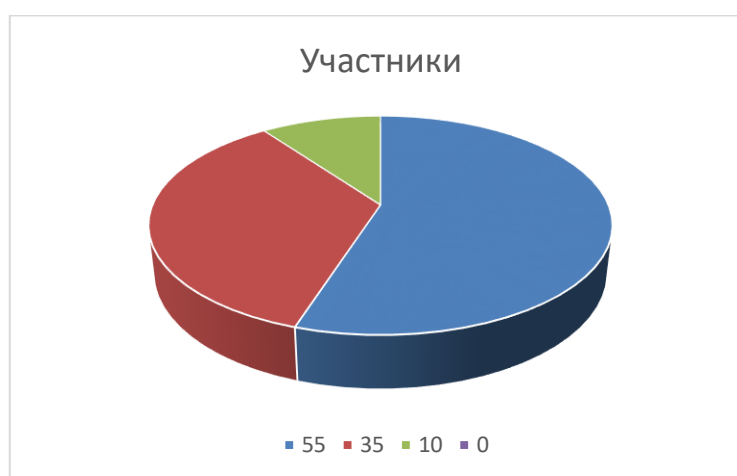
Рисунок 2 - Результаты исследования деятельностного компонента сформированности нравственных представлений по методике «Закончи историю»

Данные таблицы представлены ниже в виде круговой диаграммы (рисунок 2)