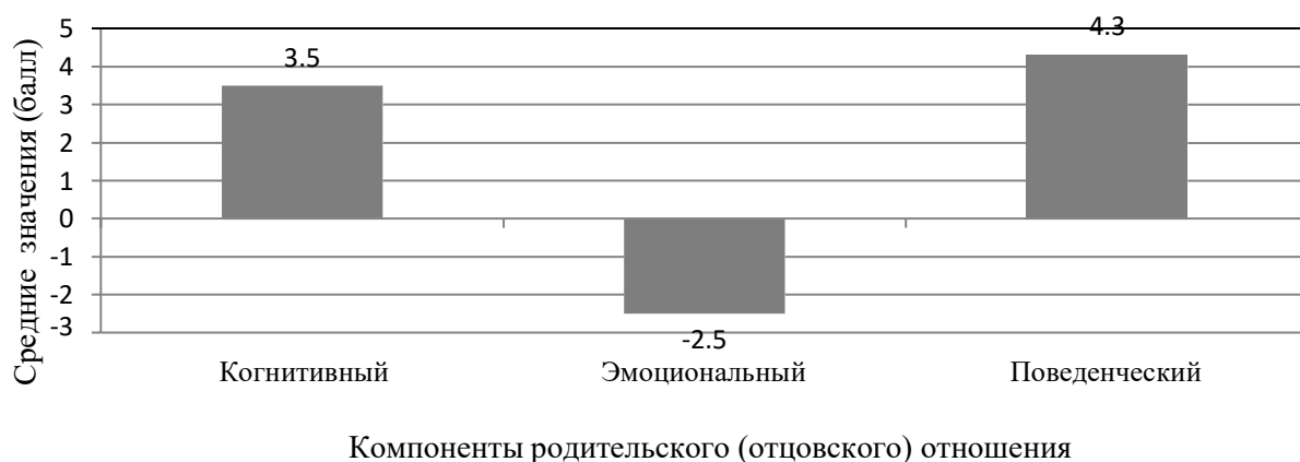
Рисунок 2. Выраженность показателей, характеризующих представления отцов, воспитывающих детей дошкольного возраста, об «идеальном родителе» (методика Р.В. Овчаровой)

По результатам исследования можно судить о том, что наиболее ярко в отцовском к детям выражен поведенческий компонент (4,3 балла) – практическая реализация способов и средств общения с ребенком, второй рейтинг у когнитивного компонента (3,5 балла) – осознание родителями собственной родительской роли. Эмоциональный компонент родительского отношения к детям у респондентов выражен слабо (-2,5 балла).