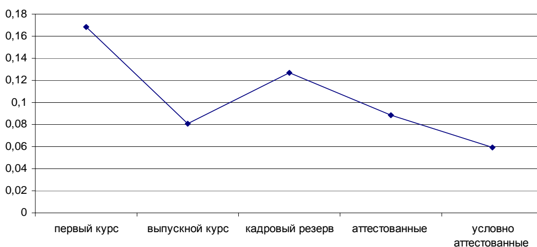
Рис.3. Различия по проценту отрицательных событий среди групп респондентов на разном этапе профессионального самоопределения

По результатам методики «Психологическая автобиография» Е.Ю. Коржовой были выявлены значимые различия по проценту отрицательных событий в общем количестве, указанных респондентами событий, H = 8,13, p = 0,086 .