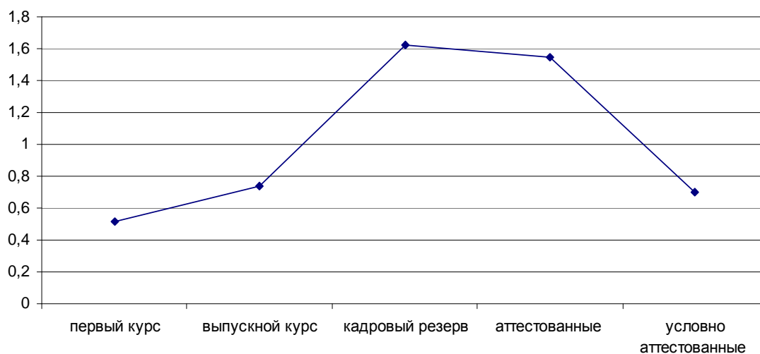
Рис.4. Различия между групп респондентов по зависимости событий от самого человека

Далее мы проанализировали по группам респондентов частоту отнесения событий связанных с профессиональной деятельностью к событиям зависимым от обстоятельств или от самого человека. Были выявлены значимые различия по значимости зависимости событий от самого человека H=15,32 , p=0,004 . Зависимость событий в большей степени от себя самого выделяют респонденты группы кадрового резерва и аттестованных сотрудников. У группы условно аттестованных и студентов выпускных курсов зависимость событий от самого человека менее выделена; у студентов первого курса зависимость события от человека выделена меньше всех остальных групп. Различия в зависимости событий от самого человека представлены на рис.4.