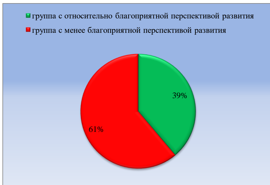
Рисунок 6 – Распределение испытуемых на группы по уровню сформированности глагольного словаря

Результаты суммирования данных по четырем блокам представлены в таблицах 14–15 (Приложение Е) и на рисунке 6.