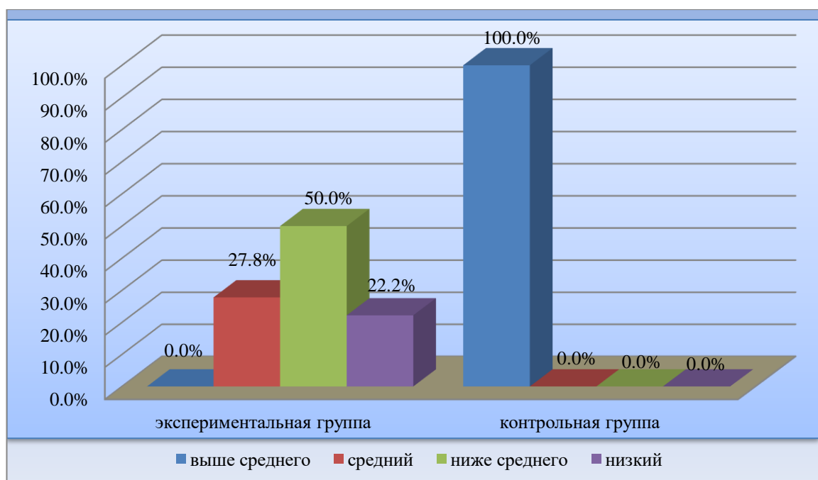
Рисунок 3 – Распределение результатов эксперимента по уровням сформированности активного словаря

Результаты исследования активного словаря представлены в таблицах 6–7 (Приложение Б) и на рисунке 3.