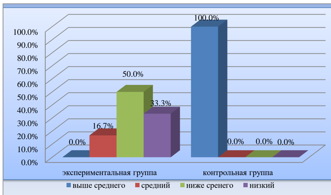
Рисунок 5 – Распределение результатов эксперимента по уровням сформированности грамматических форм глаголов в экспрессивной речи

Различия между экспериментальной и контрольной группой хорошо показаны на гистограмме и говорят об уровне сформированности грамматических форм глаголов в экспрессивной и импрессивной речи.