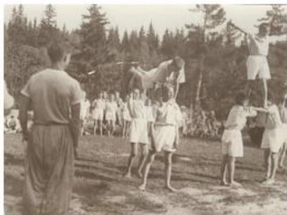
Источник 1. Спортивный праздник в пионерском лагере 1930-е.

Задание. Используя предложенные фотографии, охарактеризуйте образ нового советского человека.