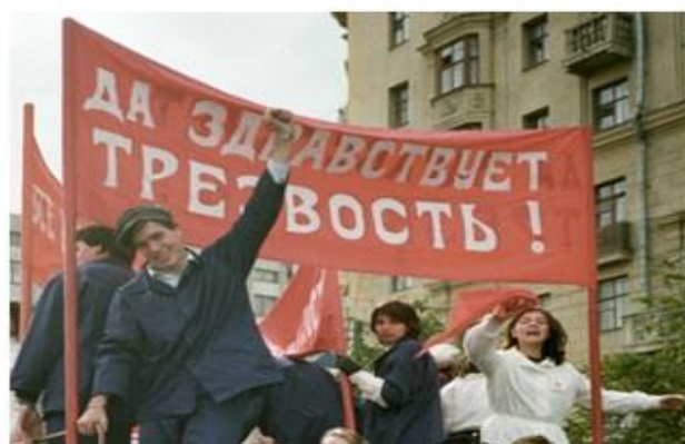
Источник 2. Лозунг антиалкогольной компании