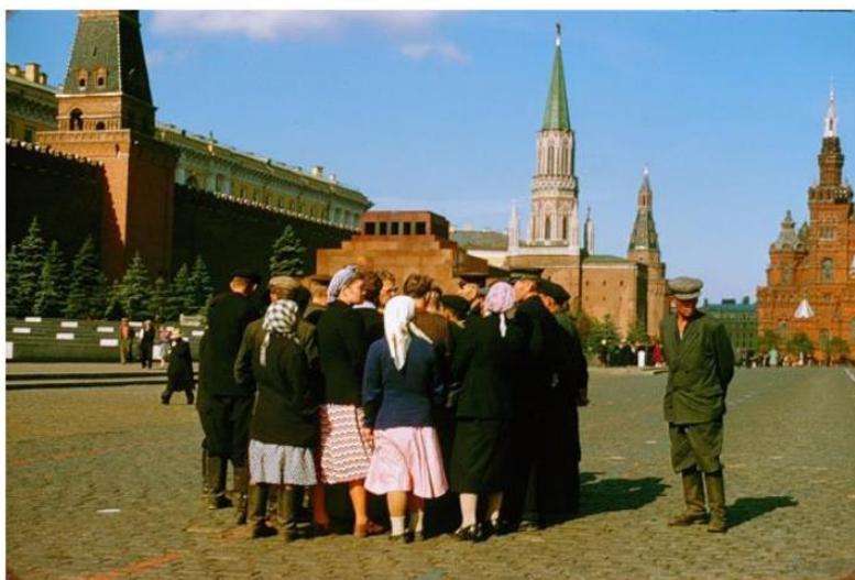
Рис. 1. СССР. 1956 год.

в) авторская разработка учителя истории и обществознания, Т. Ушань 57 , в рамках продемонстрирован алгоритм анализа фотографии 1956 года (рис.1) в рамках темы «СССР в 1953-1964 гг. Попытки реформирования советской системы».