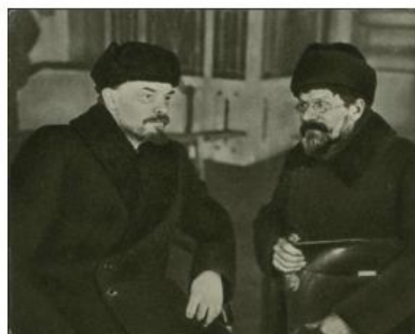
Рис. 5. В.И. Ленин и М. Калинин. 1920

При изучении истории 1920-1930 годов, включение фотодокументов позволяет продемонстрировать политическое и социально-экономическое развитие страны. Что касается персоналий, то здесь невозможно обойтись без фотографий государственных деятелей, таких как В.И. Ленина, Л.Д. Троцкого, И.В. Сталина (рис.6), их окружения и остальных высших должностных лиц СССР. Также включение фотодокументов при изучении таких процессов, как «коллективизация» (рис.7) и «индустриализация», позволит не только проиллюстрировать политику, но и также позволит передать «атмосферу»