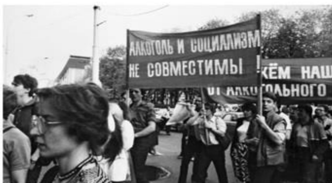
Источник 1. Лозунги антиалкогольной компании

Задание 3. Используя представленные фотографии, определите методы проведения алкогольной компании и ее эффективность.