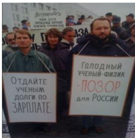
Источник 1. Демонстрации

Задание. Используя предложенные фотографии, охарактеризуйте качество жизни российского гражданина в 1990-е годы и как следствие эффективность проводимой экономической политики.