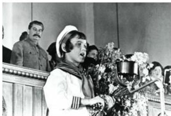
Источник 4. "Спасибо товарищу Сталину за наше счастливое детство". 1930-е.