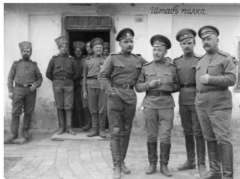
Рис. 3. Офицеры штаба полка. 1915

При изучении периода 1917 – начала 1920-х годов, в рамках которого изучаются Февральская революция 1917 года, Октябрьская революция 1917 года, Гражданская война 1917 – 1922 годов и политической и социально-экономическое развитие, возможности включения фотодокументов достаточно обширны, поскольку темы достаточно освещены в исторических источниках. Дополнительно использование фотодокументов позволит воссоздать атмосферу и настроения участников и изучаемого периода. Детально рассматривая возможности включения