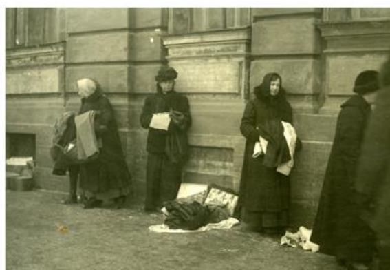
Источник 4. Уличная торговля. Петроград, 1919