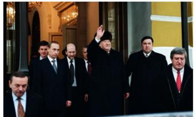
Рис. 13. Отставка Б. Ельцина 1999

Во-вторую очередь, в ходе изучения истории, фотодокументы могут выступать в роли исторического источника. Поскольку не все фотографии могут быть полезны в образовательном процессе, стоит сказать о необходимости тщательного отбора фотодокументов. Из многообразия видов фотографии в