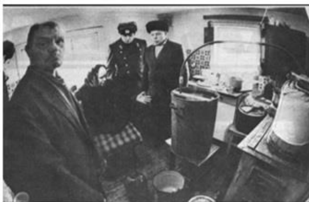
Источник 3. Борьба с самогонарением