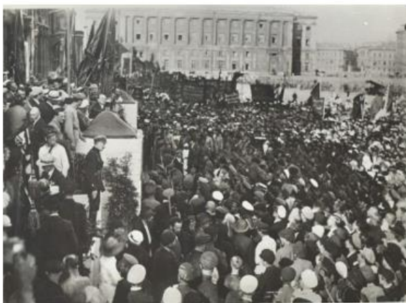
Источник 3. Митинг. В. Булла. 1920