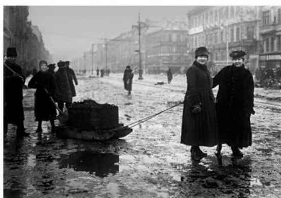
Источник 1. Трудявая повинность. Петроград, 1918

Задание 3. Используя предложенные исторические источники, охарактеризуйте общественное настроение в период проведения политики военного коммунизма.