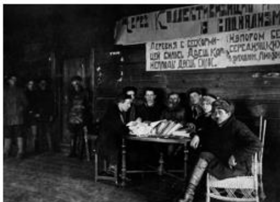
Источник 3. Заседание комиссии содействия книгораспределению в деревне. 1930.