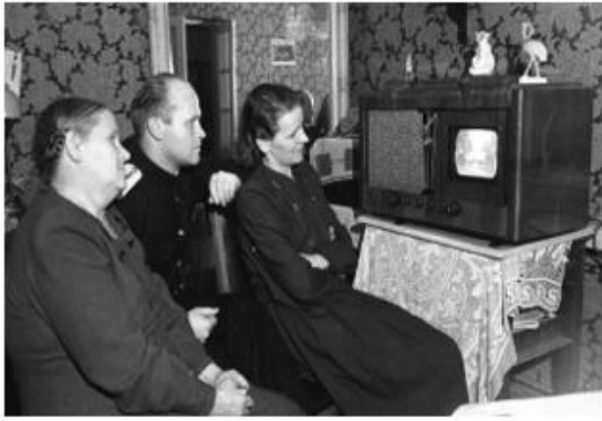
Рис. 10. У телевизора. 1950-е