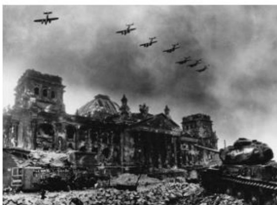
Рис. 9. Война закончилась. Берлин. 1945

В процессе изучения периода истории России 1945-1991 годы использование фотодокументов позволяет формировать у обучающихся представление о политическом развитии страны, о политических «курсах», о внутренних политических кризисах, о внешней политике СССР и участии в международных конфликтах, о политических деятелях партии; в области экономического развития освещать восстановление страны после войны, проведенные экономические политики, их мероприятия и итоги; в социальной сфере демонстрировать уровень жизни населения (рис.10). Отдельный блок фотодокументов эффективно использовать при освещении культурного пространства (рис.11) и повседневной жизни людей.