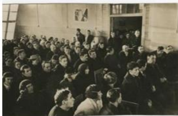
Источник 2. Партийно-комсомольское собрание, 1939.