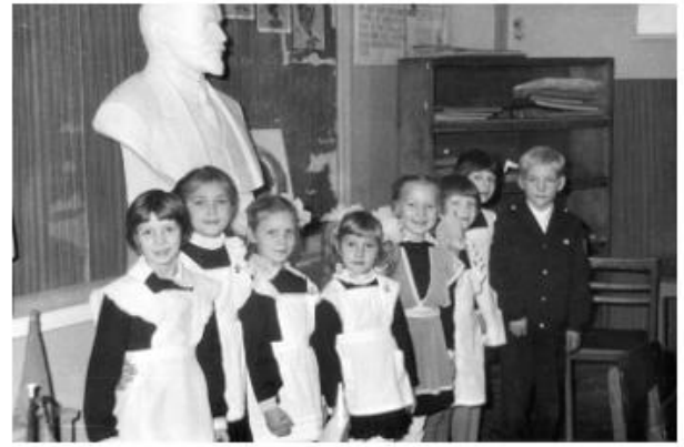
Рис. 11. Прием первоклассников в ряды Октябрят. 1984

При изучении периода становления Российской Федерации и последующего развития вплоть до 2014 года (последняя редакция учебника) фотодокумент возможно использовать при изучении в первую очередь политической истории, поскольку период 1990-х годов знаменуется политической активностью населения. Переход к рыночной системе и вызванные им социальные изменения также находят свое отражение в фотографиях тех лет. Кроме этого, происходившие политические и экономические преобразования и последствия прекращения существования СССР внесли существенные изменения в жизнь граждан нашей страны.