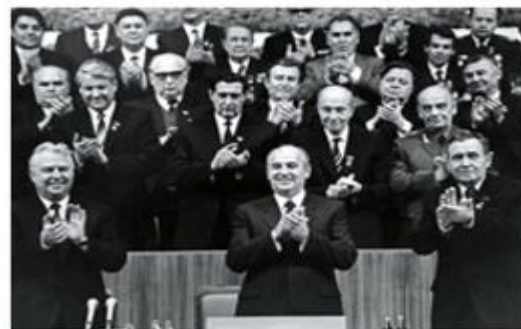
Источник 1. Избрание М.С. Горбачева генеральным секретарем в 1985 году

Задание 1. Вам приведено высказывание Михаила Сергеевича Горбачева, сказанное на встрече с активом Ленинградского горкома партии, и в последствие, ставшее лозунгом начавшихся социально-экономических преобразований.