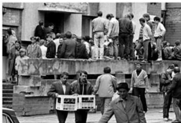
Источник 4. Продажа алкоголя