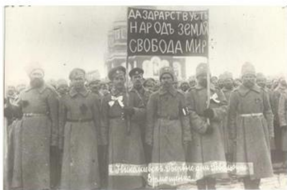
Рис. 4. Николаевск. Первые дни Февральской революции

фото документов при изучении периода начала Февральской революции и окончании Гражданской войны, с целью представить: ход, участников и последствия революций (рис.4) и Гражданской войны; проведение большевистской политики впервые годы власти, а также повседневную жизнь людей в период всех преобразования, отдельно стоит выделить персоналии, поскольку их роль в этот период и после заслуживает отдельного анализа и рассмотрения обучающимися (рис.5).