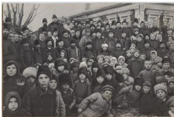
Источник 4. Открытие Кашинской электростанции. 1920