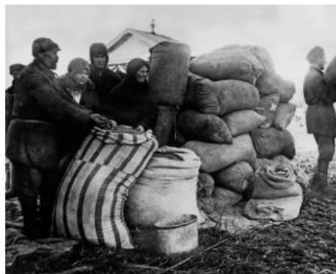
Рис.7. Реквизиция зерна. 1928