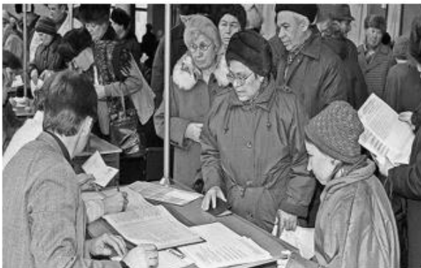
Рис. 12. Референдум 1993 года

При изучении периода становления Российской Федерации и последующего развития вплоть до 2014 года (последняя редакция учебника) фотодокумент возможно использовать при изучении в первую очередь политической истории, поскольку период 1990-х годов знаменуется политической активностью населения. Переход к рыночной системе и вызванные им социальные изменения также находят свое отражение в фотографиях тех лет. Кроме этого, происходившие политические и экономические преобразования и последствия прекращения существования СССР внесли существенные изменения в жизнь граждан нашей страны.