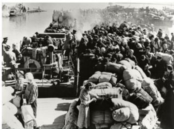
Рис. 8. Ладога "Дорога жизни". 1942

Отдельный блок фотографий посвящен периоду 1941-1945 годов, использование которых также позволит сформировать у обучающихся не только представление об Великой Отечественной войне, но морально-нравственное и эмоциональное, личностное отношение к событиям тех лет. По данному периоду фотодокументы возможно использовать с целью представить историю войны через призму жизни людей на фронте и в тылу. Это может быть как повседневная жизнь рабочих на заводе, так и фотографии военных действий. Дополнительно возможно организовать проектную учебную деятельность с использованием семейных фотографий обучающихся.