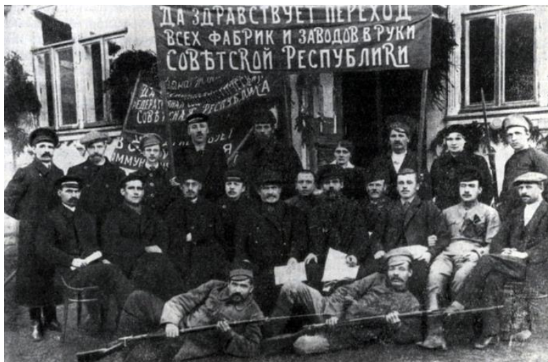
Источник 2. Национализация