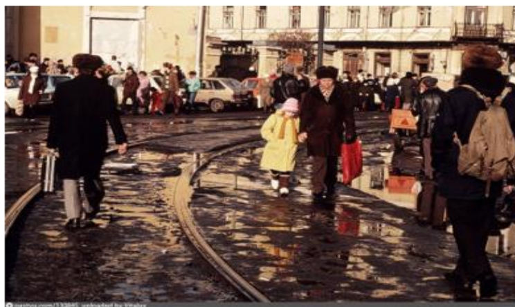
Источник 2. Санкт-Петербург в 1990-е годы