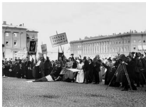
Рис. 2. На Дворцовой площади в момент провозглашения манифеста о вступлении России в войну. 1914

При изучении Первой Мировой войны при помощи фотодокументов можно сформировать представление о ключевых событиях и персоналиях, например объявление о вступлении России в войну (рис.2); о вооруженных силах стран-противниц, а именно условиях жизни солдат, их обмундировании (рис.3) и участиях в военных сражениях; о санитарной службе на фронте, о повседневной жизни людей в тылу.