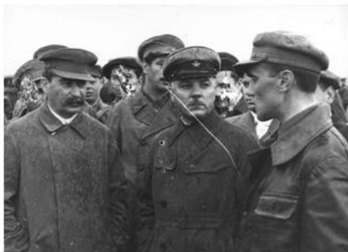
Рис.6. И. Сталин и К. Ворошилов

При изучении истории 1920-1930 годов, включение фотодокументов позволяет продемонстрировать политическое и социально-экономическое развитие страны. Что касается персоналий, то здесь невозможно обойтись без фотографий государственных деятелей, таких как В.И. Ленина, Л.Д. Троцкого, И.В. Сталина (рис.6), их окружения и остальных высших должностных лиц СССР. Также включение фотодокументов при изучении таких процессов, как «коллективизация» (рис.7) и «индустриализация», позволит не только проиллюстрировать политику, но и также позволит передать «атмосферу»