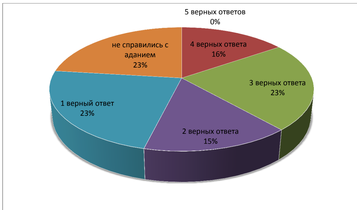
Рис. 1 Результаты тестирования на знание лингвокультурологической информации на диагностическом этапе исследования

Формирующий этап состоял из серии уроков: