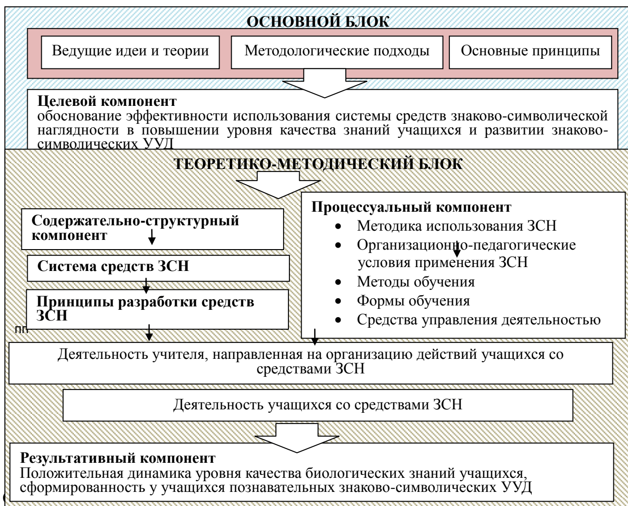
Рис. 1. Модель методики обучения биологии с применением знаково-символической наглядности (базовый уровень IX класс)