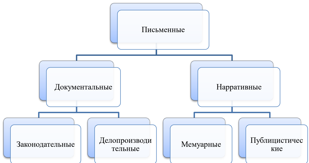
Рис. 1. Классификация исторических источников по религиозной политике.

исследователь должен интерпретировать его содержание. Интерпретация является важным инструментом исследователя, поскольку позволяет максимально понять содержание и смысл исторического источника, но, тем не менее, существуют некоторые проблемы анализа и интерпретации источников. В первую очередь проблемы источниковедческого исследования зависят от вида источника. Мы уже говорили о том, что в нашем исследовании письменные источники представлены четырьмя видами, каждый из которых имеет свою проблематику.